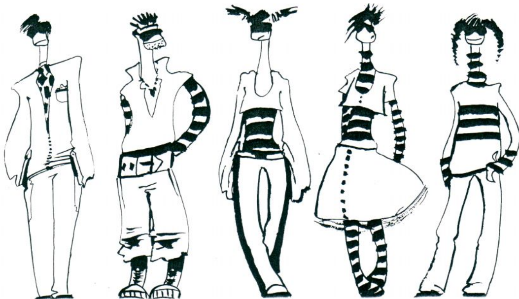
Рисунок В. 3 – Стиль в графике