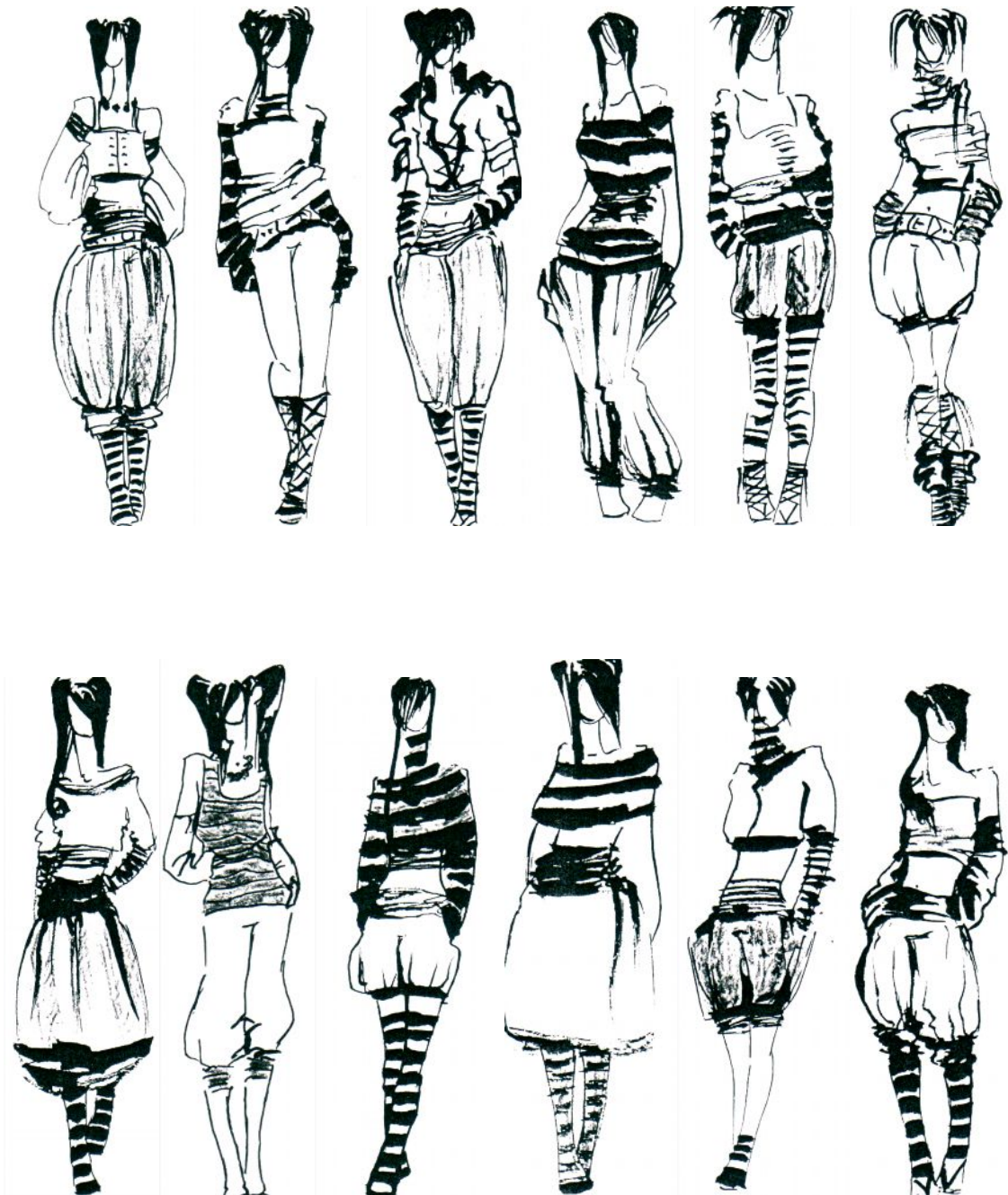
Рисунок В. 1 – Стиль в костюме

Пример выполнения курсового проекта «Выявление стиля в формообразовании костюма»