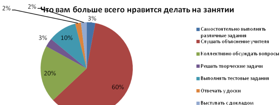
Рисунок 2 - Предпочтительные формы работы учащихся на учебных занятиях

Отметим, что анализируя полученные данные, можно сделать вывод, что большинство опрошенных предпочитают выполнять репродуктивные и пассивные формы работы на учебных занятиях (60 %), 20 % респондентов предпочитают фронтальные формы работы, а активные формы работы, предполагающие самостоятельный мыслительный поиск, предпочтительны лишь для 20 % учащихся.