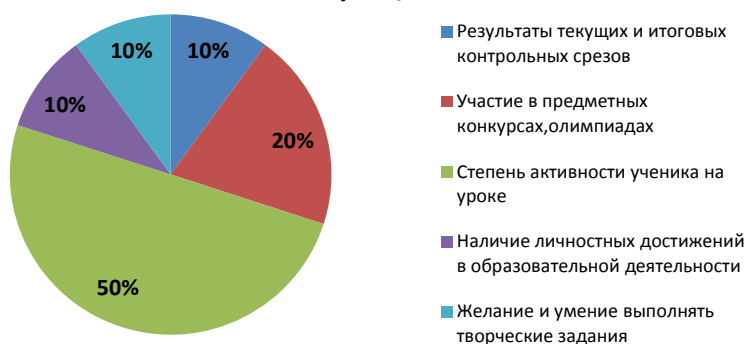
Рисунок 5 - Критерии успешности учащихся

Таким образом, приведенный для примера анализ исследования в рамках преддипломной педагогической практики, позволяет будущим бакалаврам пользоваться им для сбора, обработки и анализа данных,