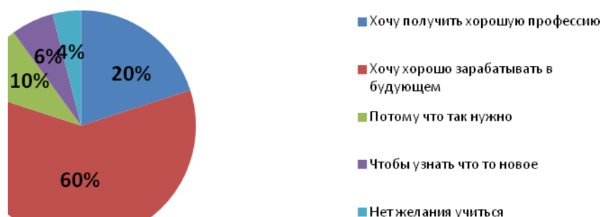
Рисунок 1 - Причины, по которым учащиеся хотят учиться

Анализируя полученные данные, можно сделать вывод, что в группе преобладают прагматические мотивы, поскольку большинство опрошенных выбрали вариант ответа «хочу хорошо зарабатывать в будущем» (60 %). Огорчает тот факт, что 4 % учащихся отмечают, что у них нет никакого желания учиться, а 10 % респондентов, выбрав ответ «потому что так нужно», скорее всего, так же не проявляют яркого желания получать знания. Положительную направленность на учебную деятельность, как показывают данные анкетирования, имеют 26 % опрошенных учащихся (20 % из которых выбрали ответ «хочу получить профессию» и 6 % «хочу учиться, чтобы узнавать что-то новое».