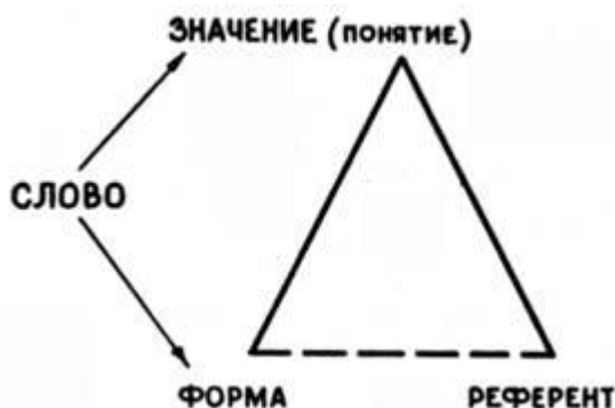
Рисунок 2 – Взамоотношение между формой, значением и референтом