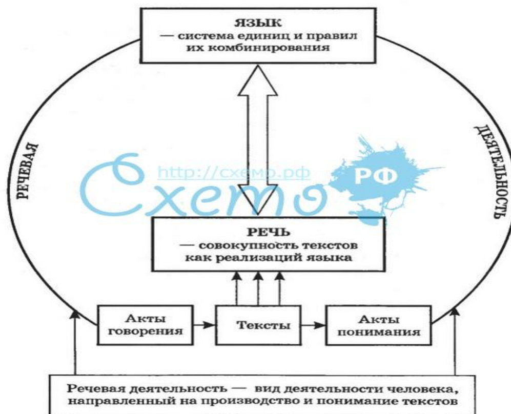
Рисунок 1 – Язык, речь, речевая деятельность