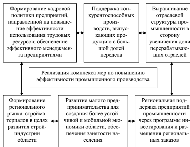
Рисунок 2. Основные направления промышленной политики Оренбургской области

Большинство предприятий не имеет достаточных инвестиционных ресурсов для проведения технологического перевооружения. Поэтому работы по реконструкции и модернизации производства практически не осуществляются. Это не позволяет многим предприятиям нала-