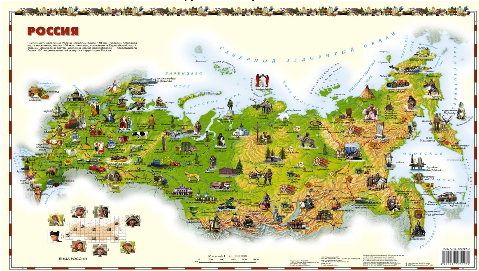
Рисунок В.1 – Туристская карта России