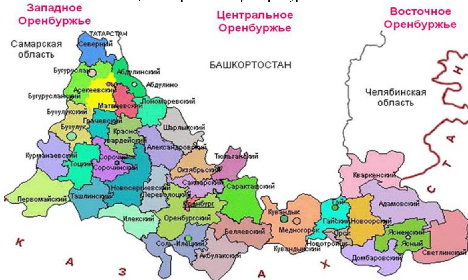
Рисунок Д.1 – Административная карта Оренбургской области