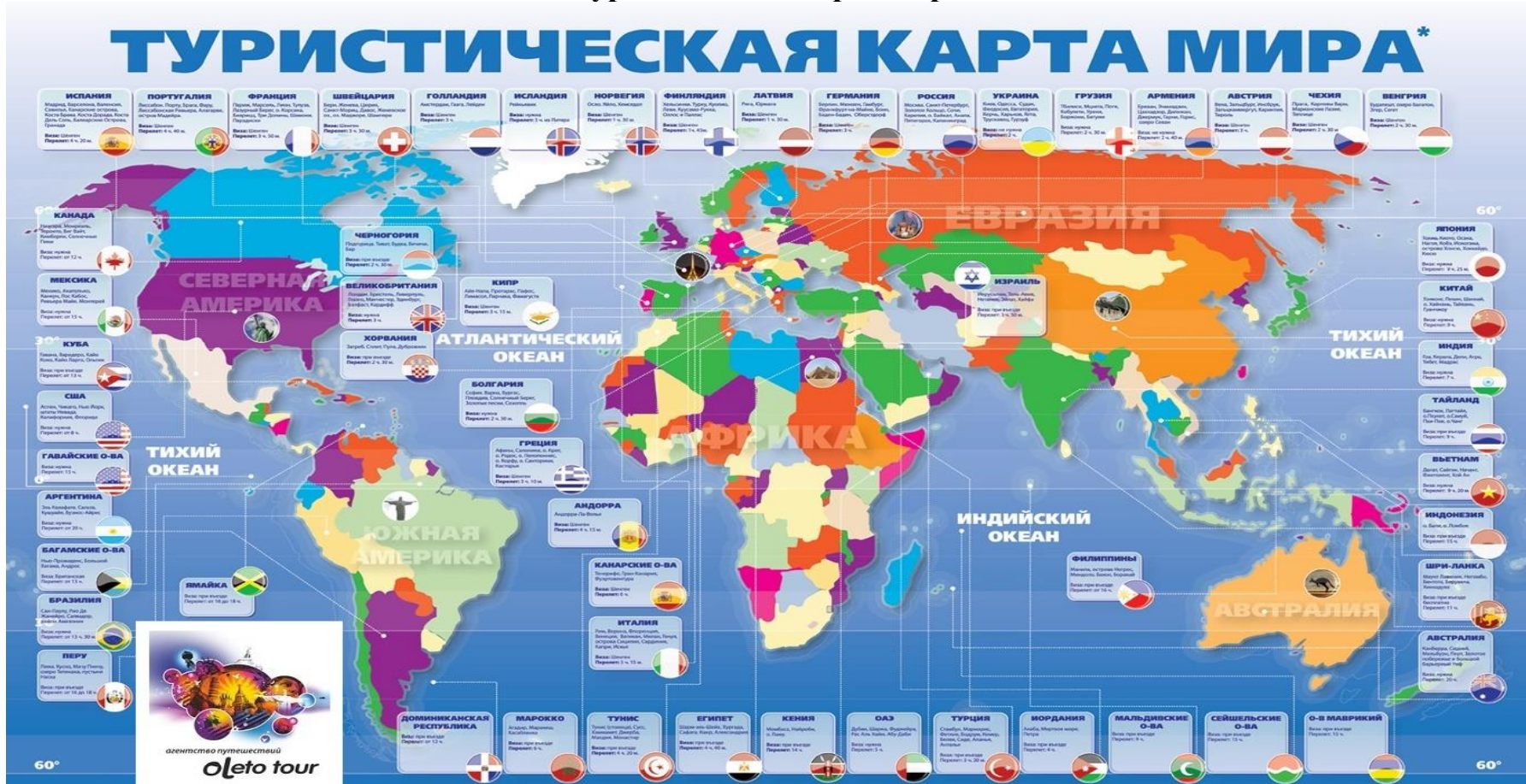
Рисунок Б.1 – Туристическая карта мира