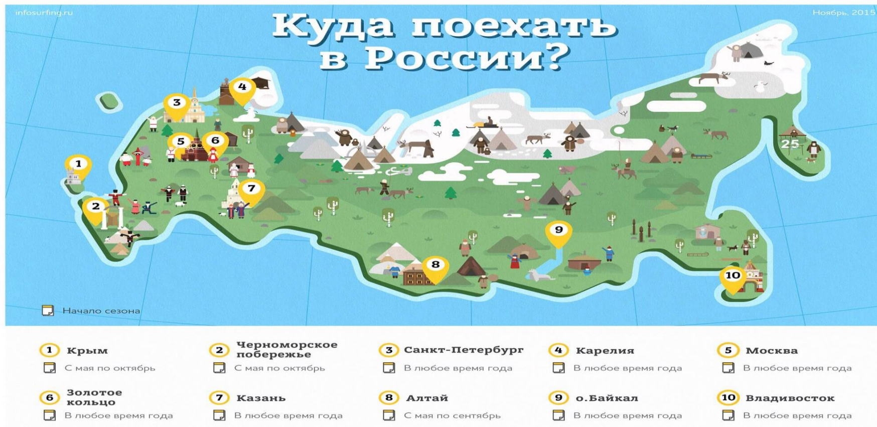
Рисунок А.1 – Туристская карта РФ