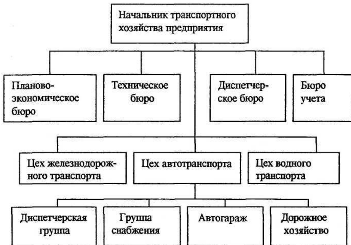
Рисунок Б.1 – Организационная структура транспортного хозяйства автотранспортного комплекса