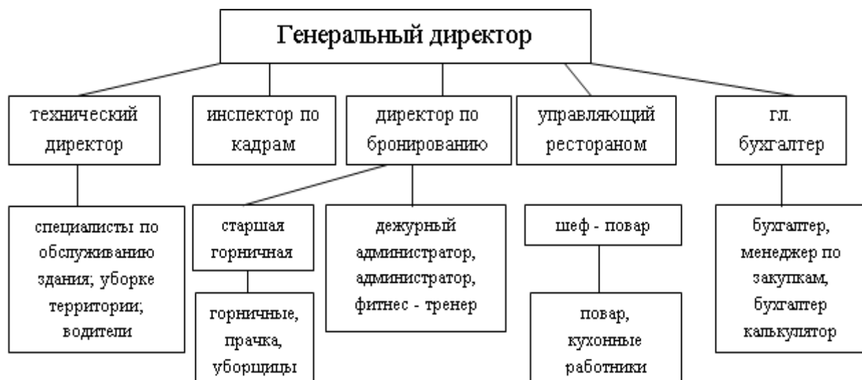
Рисунок Б.1 – Организационная структура ООО «Паритет»