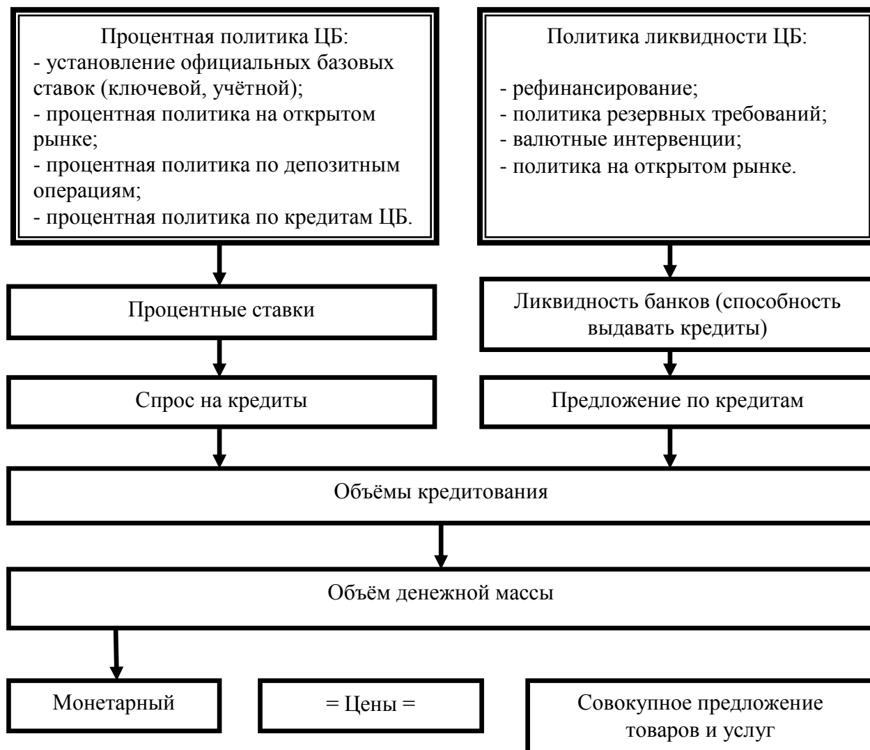
Рисунок 3 - Механизм действия монетарной политики [1]

Прямая зависимость прослеживается и между объёмом кредитования, а также величиной денежной массы в обращении. Наконец, от объёма денежной массы в обращении и совокупного объёма предложения на рынке товаров и услуг зависит уровень цен (рисунок 3).