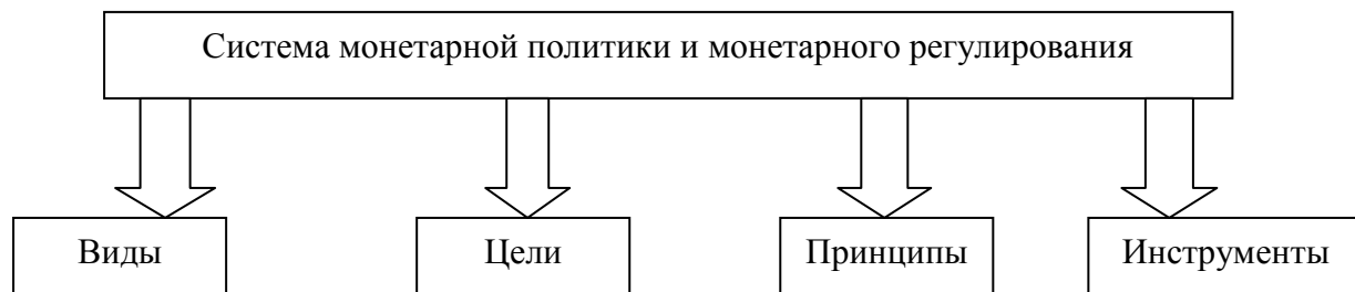
Рисунок 2 – Элементы системы монетарной политики и монетарного регулирования

Монетарное регулирование и монетарная политика очень тесно взаимосвязаны, но первична, конечно же, монетарная политика. Прежде, чем осуществлять монетарное регулирование Центральный банк формирует монетарную политику. В качестве практических аспектов ее формирования выделяют следующие моменты: