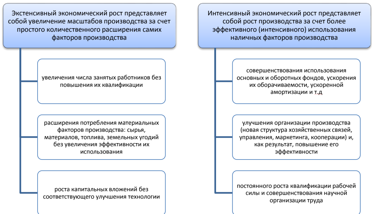
Рисунок 1 – Стратегии достижения экономического роста

Экономический рост представляет собой выход экономики за пределы ранее существовавших производственных возможностей, переход ее к новому, более высокому уровню. Экономический рост есть составляющая циклического экономического развития.