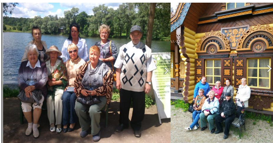
Рисунок 1 –Фото с экскурсионных маршрутов.

Православно–этнографическое направление предлагает познакомиться с историей, архитектурой, иконописью, ремесленными традициями Московской и других областей; дает возможность прикоснуться к истокам православной культуры, ознакомиться с ее традициями, ценностями, наследием, принять участие в религиозных церемониях. Планируя экскурсионные маршруты стараюсь подготовиться и в процессе поездки рассказать своим подопечным об истории того или иного региона, в который мы направляемся.