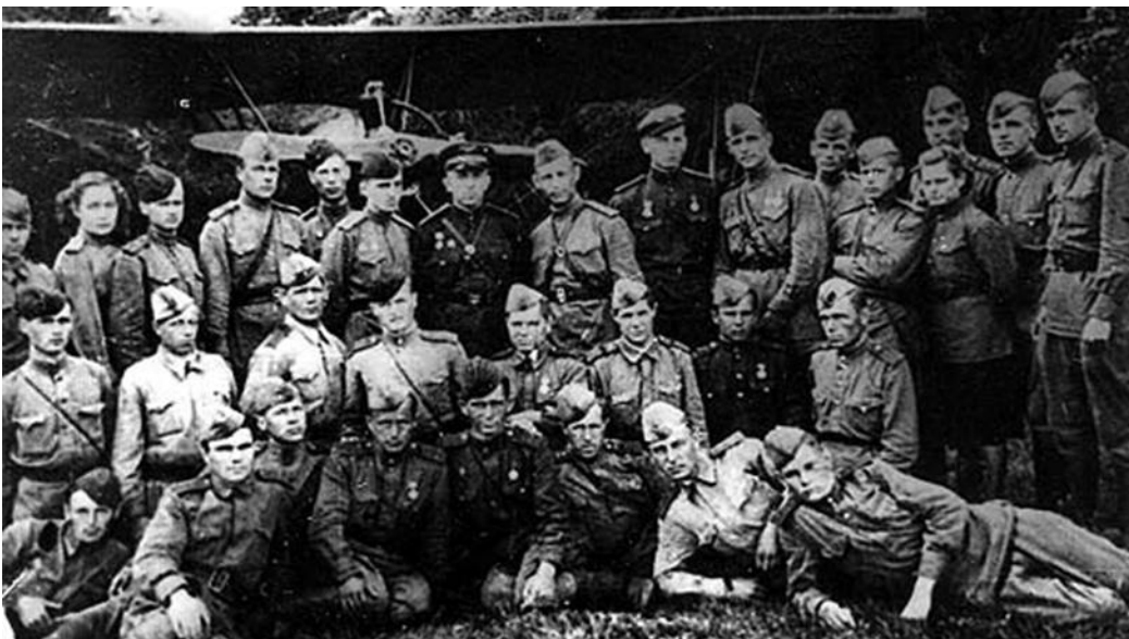
Рис. 2 – Личный состав 424 АЭ у самолета