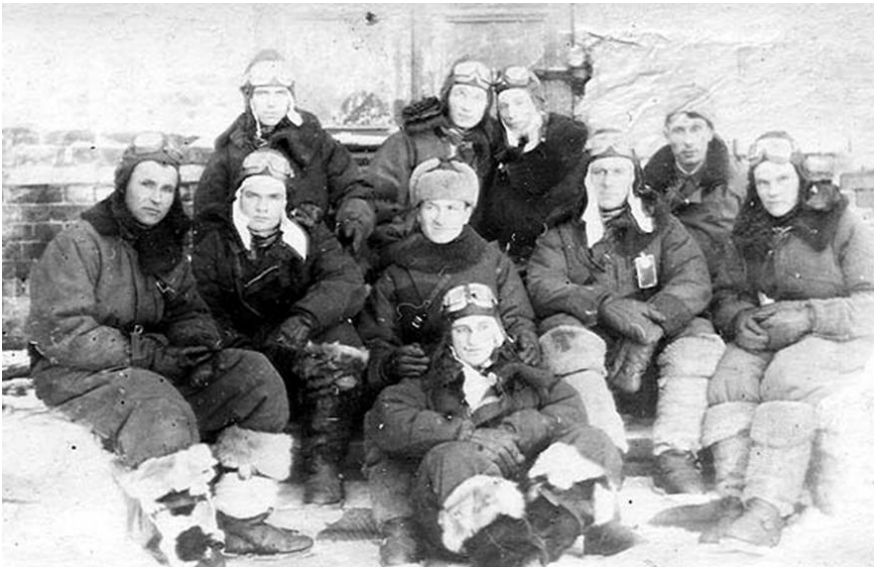
Рис. 4 – Личный состав 424 АЭ после вылетов.