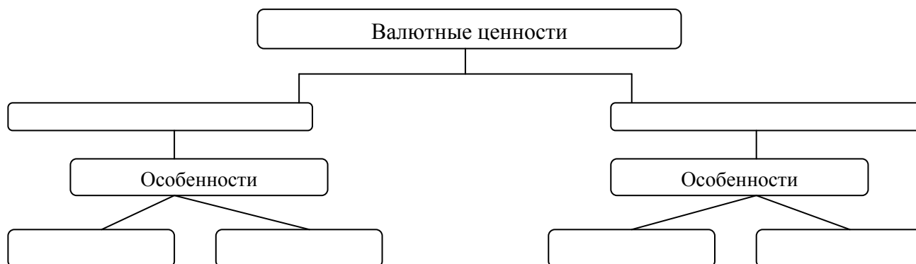
Рисунок 3 – Виды и особенности валютных ценностей (примерная схема)

Используя подготовленный к занятию материал, составьте схему, отражающую виды и особенности валютных ценностей (примерная схема представлена на рисунке 3).