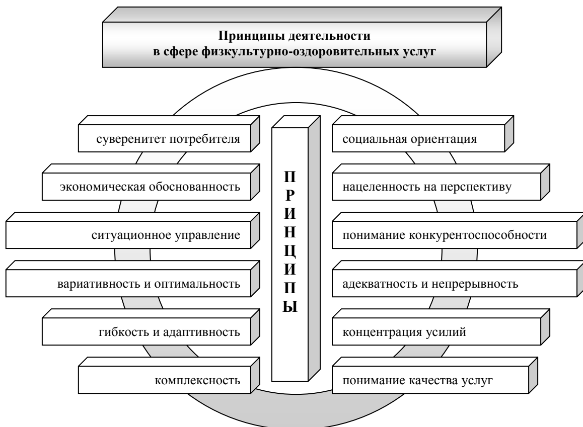
Рисунок 2 – Принципы деятельности в сфере физкультурно-оздоровительных услуг

Формулы нумеруют сквозной нумерацией арабскими цифрами. Номер формулы записывают в круглых скобках справа от нее. Пояснения символов приводятся после формулы с новой строкой, в которой эти символы приведены в формуле. Первую строку пояснения начинают со слова «где».