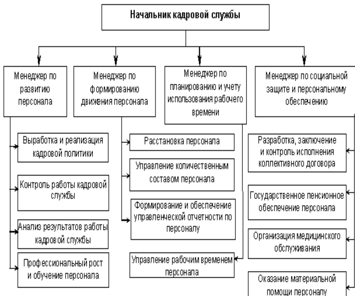
Рисунок И.1 - Структура и функции кадровой службы ООО «Эверест»