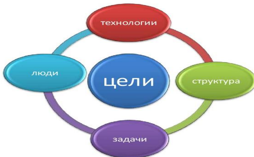
Рисунок Е.2 – Факторы внутренней среды ЗАО «ИНМАН»