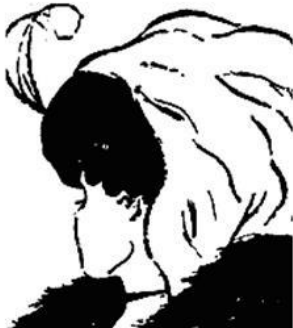
Рисунок 1 – Иллюзия восприятия Э.Боринга

6 Проанализируйте приведенные примеры и попытайтесь объяснить, за счет чего повышается разрешающая способность анализаторов у космонавтов.