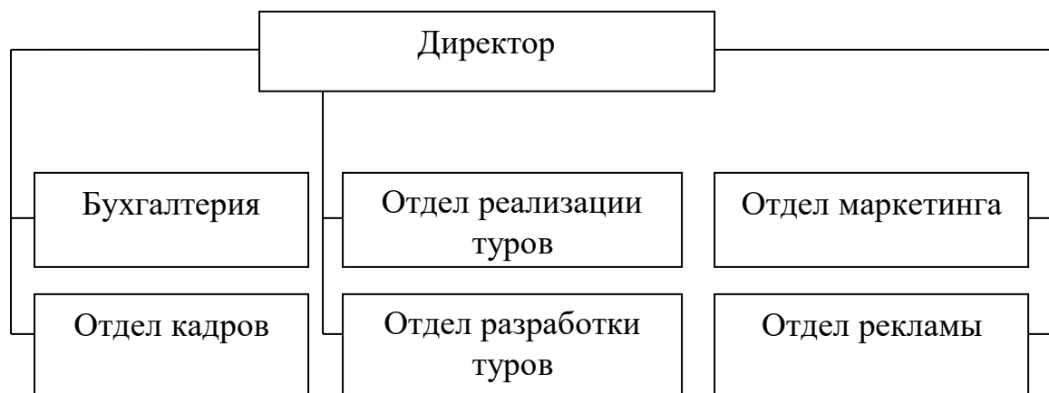
Рисунок А.1 – Организационная структура управления туристического оператора