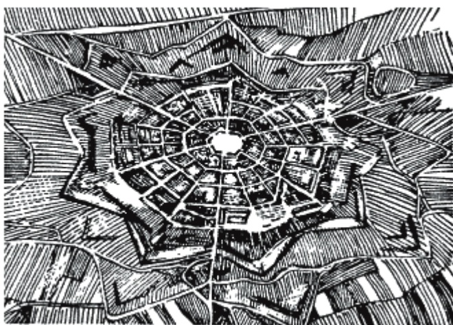
Рисунок 1 – Палма-Нова, Италия: строгий градостроительный план

Во 2-й половине XV века было несколько попыток воплотить в жизнь проекты «идеального» города. Они нашли свое проявление как в проектировании новых городов, так и в преобразовании существующих средневековых городов. Проектировались целые военные города, среди которых выделяется город-крепость Терра-дель-Соле («Солнечный край»), возведенный в конце XVI века по велению Козимо I Медичи. Кульминацией фортификационной архитектуры Возрождения стал город-крепость Пальманова, план которого имеет форму звезды, а улицы расходятся лучами от расположенной в центре площади.