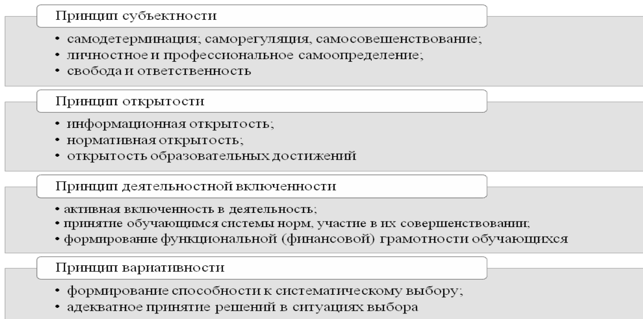
Рисунок 1 - Принципы формирования финансовой грамотности субъектов образовательных отношений в системе дополнительного образования

достижению высоких результатов в области функциональной грамотности, в качестве одной из шести основных содержательных составляющих которой (математическая грамотность, читательская грамотность, естественнонаучная грамотность, финансовая грамотность, глобальные компетенции, креативное мышление) является финансовая грамотность [36].