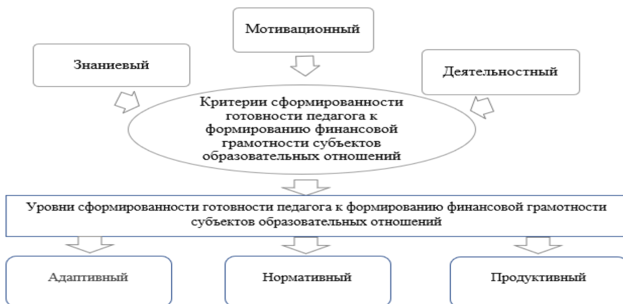
Рисунок 3 - Критерии и уровни готовности педагога к формированию финансовой грамотности субъектов образовательных отношений в системе дополнительного образования

Вышеизложенное позволяет сделать следующие выводы: разработанная на основе компетентного и личностно-ориентированного подходов модель управления формированием финансовой грамотности субъектов образовательных отношений в системе дополнительного образования, включающая следующие взаимосвязанные блоки: целевой (подход, принципы, функции), содержательный, технологический, результативно-рефлексивный блоки обеспечивают организационно-методические условия для оптимального повышения уровня финансовой грамотности субъектов образовательных отношений в системе дополнительного образования.