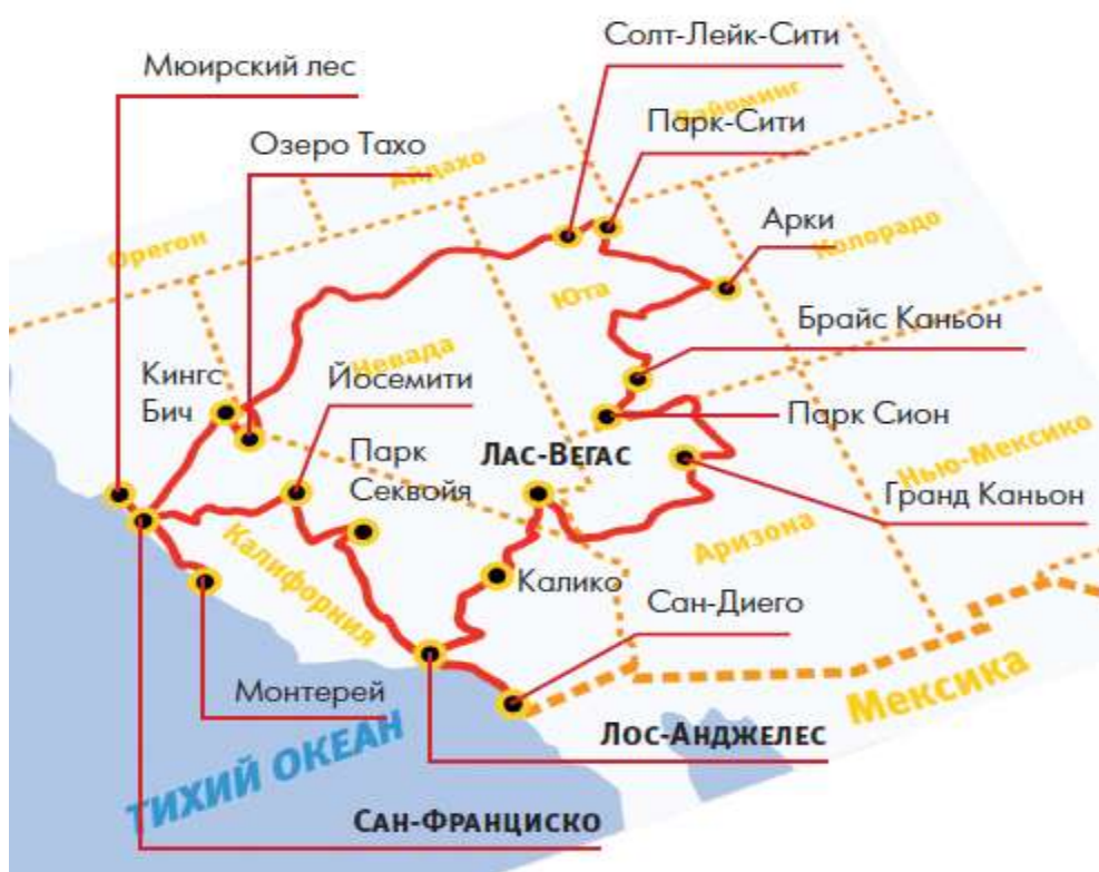
Рисунок 1- Карта-схема расположения национальных парков на территории США

Каждый подпункт (например, 1.1, 1.2, 1.3, 2.1, 2.2 и т.д.) должен содержать графический материал (таблицы, рисунки, диаграммы, графики), придающий курсовой работе наглядность. Примеры таблиц и рисунков для курсовой работы представлены ниже.