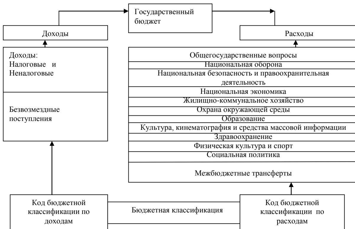
Рисунок 1 – Структура государственного бюджета

Государственный бюджет является основным финансовым планом государства, дает органам власти реальную экономическую возможность управления. Бюджет отражает размеры необходимых государству финансовых ресурсов и определяет тем самым налоговую политику в стране, структура государственного бюджета представлена на рисунке 1.