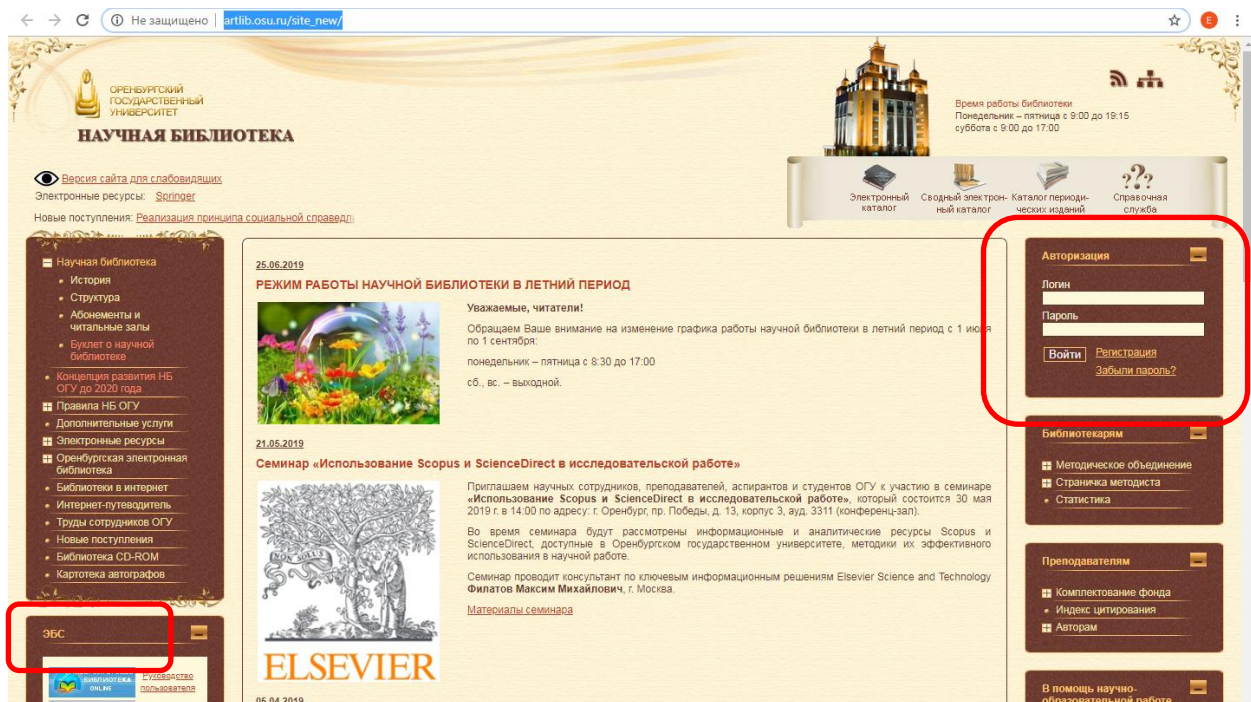
Рисунок 1 – Авторизованный доступ в научную библиотеку ОГУ

Подтверждённые учётные данные (логин и пароль) позволят обучающимся получить доступ ко многим информационным ресурсам университета через Единое окно доступа. Попасть туда можно с главной страницы официального сайта ОГУ http://www.osu.ru/ (рисунок 2).