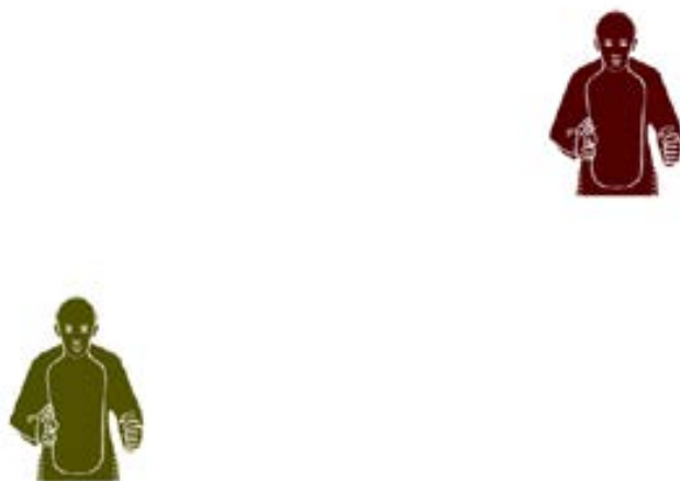
Рисунок А.3 – Образец мишени для выполнения упражнения по появляющимся мишеням