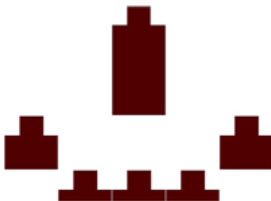
Рисунок А.4 – Образец мишени для скоростной стрельбы по мишени, движущейся по принципу маятника