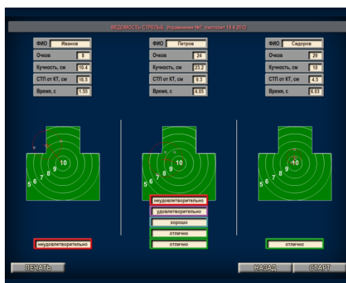
Рисунок 1 – Образец мишени с результатами выполненного упражнения

По окончании упражнения всем стрелкам, на экран выводятся таблицы результатов стрельб и изображения мишеней с пробоинами по каждому направлению. На рисунке 1 представлен образец с результатами выполненного упражнения 3-мя стрелками.