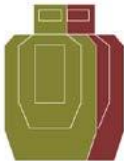
Рисунок А.5 – Образец мишени для скоростной прицельной стрельбы по мишеням «террорист» – «заложник»