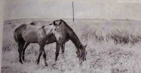
Лошади на селе до сих пор востребованы.