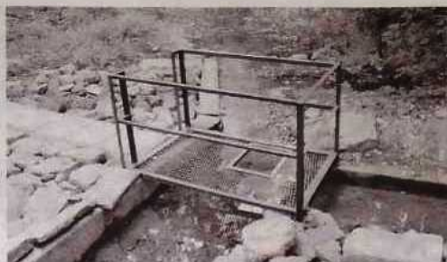
Вода в роднике с ионами серебра.