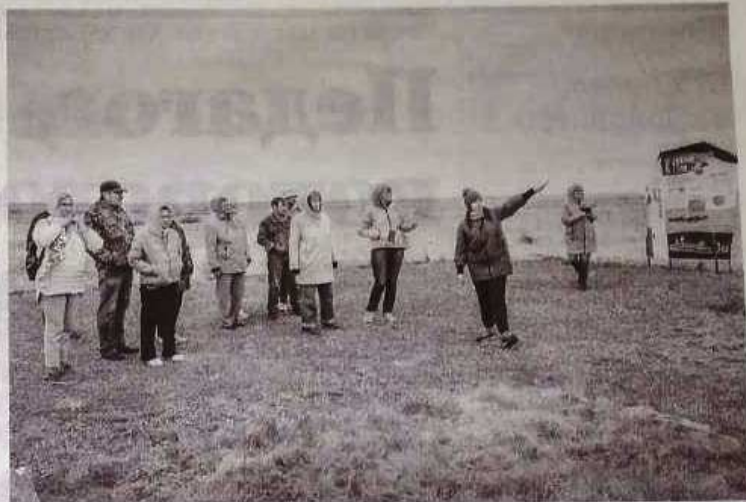
У приезжающих сюда туристов есть уникальная возможность понаблюдать за природой в ее первозданном виде.

64, как у домашних. Возможно, именно две «лишние» и определяют дикий, свободолюбивый нрав этих непарнокопытных?