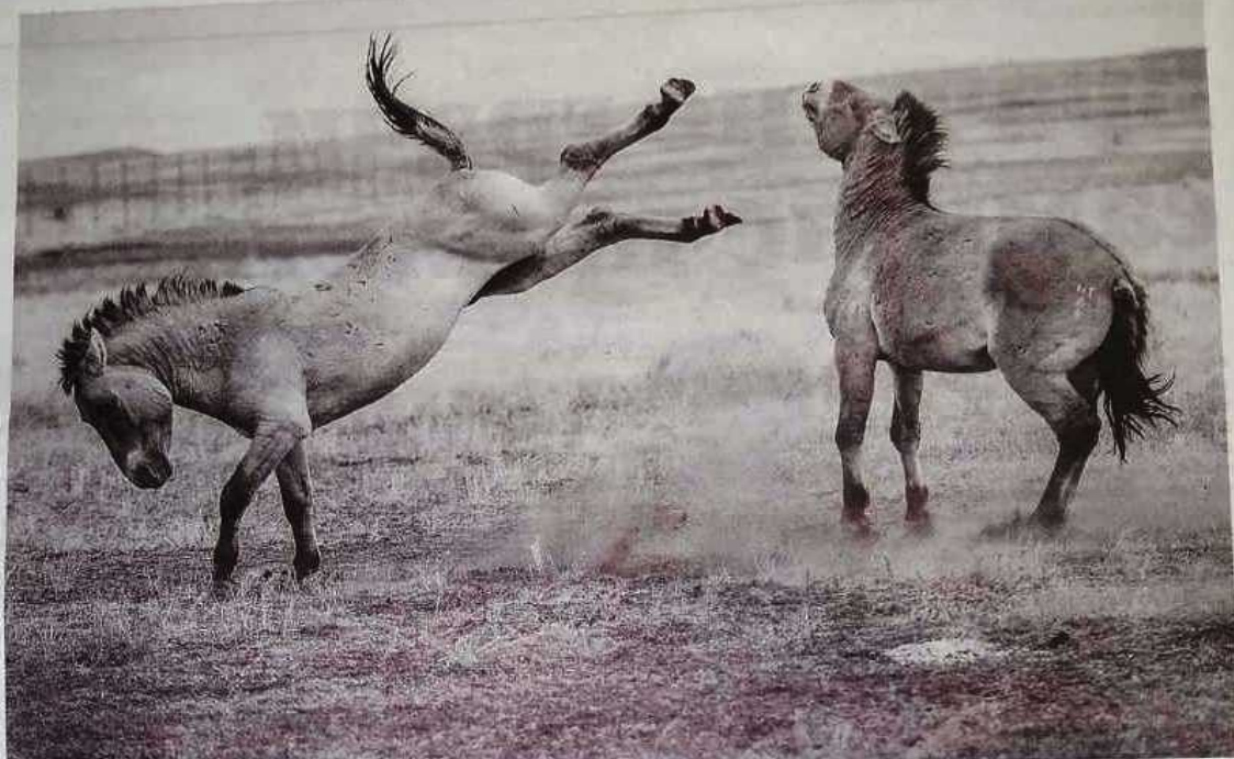
Дикие лошади очень эмоциональные, они даже боль готовы терпеть, а вот от стресса могут погибнуть.

А с 2015-го это видовое разнообразие пополнили пржевальцы. Первые шесть попали в оренбургскую степь из Франции, потом еще три десятка прибыли двумя транспортом из венгерского национального парка «Хортобать». Дикие лошади