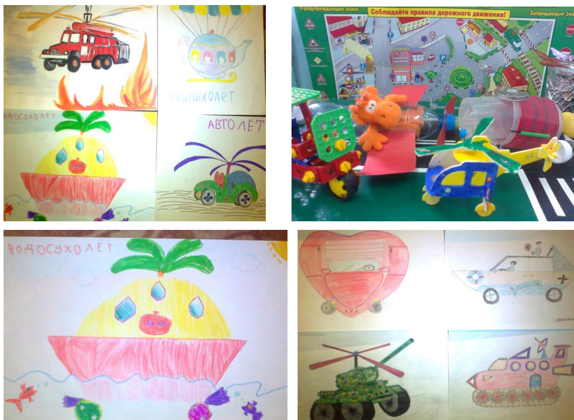
Рис.2. Изобретения детей

материалов и с различной тематикой: очищение города от мусора, очищение воздуха в городских условиях, супервездеход и т. д. Все дети с удовольствием презентовали свои изобретения.