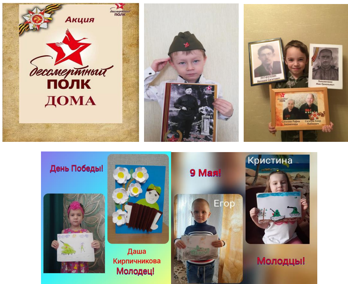
Рис.1. Акция «Бессмертный полк дома»

человека, ее глубиной. В период пандемии в группе совместно с родителями был реализован проект «Никто не забыт, ничто не забыто». В нем дети выполняли творческие задания, читали стихи, пели песни, рассматривали иллюстрации на военную тематику. А также провели акцию «Бессмертный полк дома».