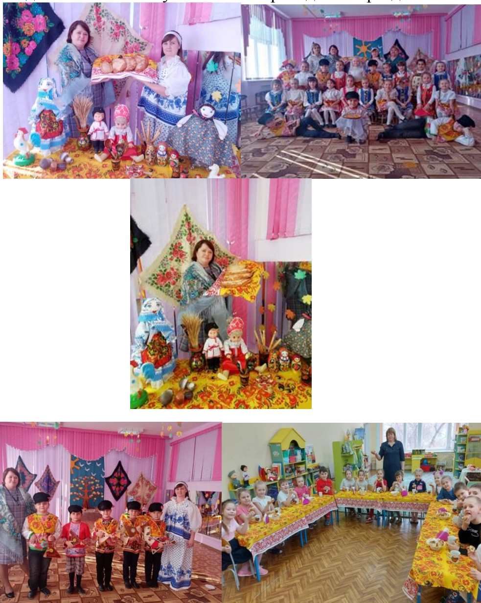
Рис.4. Родители - активные участники мероприятий

Родители принимают активное участие в творческих конкурсах: конкурсы рисунков и поделок, «Лучшая елочная игрушка», «Дары осени» и др. Родители проявляли активность и заинтересованность к совместной работе. Участие в проектах «Летний отдых семьи», «Папа самый лучший друг» и др. Родители активные участники в проведении праздников.