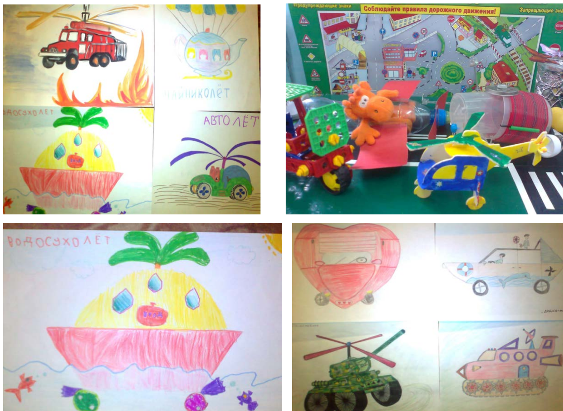
Рис.2. Изобретения детей

материалов и с различной тематикой: очищение города от мусора, очищение воздуха в городских условиях, супервездеход и т. д. Все дети с удовольствием презентовали свои изобретения.