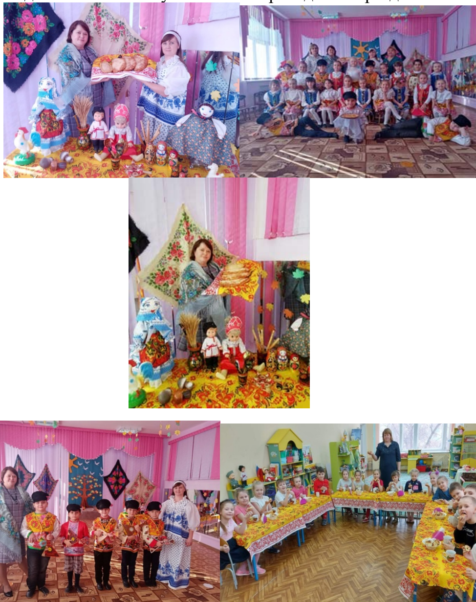
Рис.4. Родители - активные участники мероприятий

Родители принимают активное участие в творческих конкурсах: конкурсы рисунков и поделок, «Лучшая елочная игрушка», «Дары осени» и др. Родители проявляли активность и заинтересованность к совместной работе. Участие в проектах «Летний отдых семьи», «Папа самый лучший друг» и др. Родители активные участники в проведении праздников.