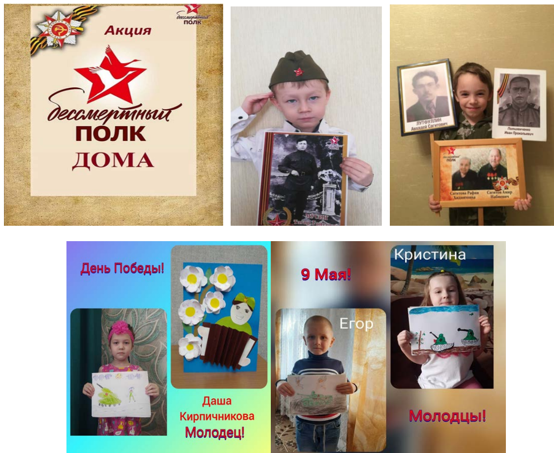
Рис.1. Акция «Бессмертный полк дома»

человека, ее глубиной. В период пандемии в группе совместно с родителями был реализован проект «Никто не забыт, ничто не забыто». В нем дети выполняли творческие задания, читали стихи, пели песни, рассматривали иллюстрации на военную тематику. А также провели акцию «Бессмертный полк дома».