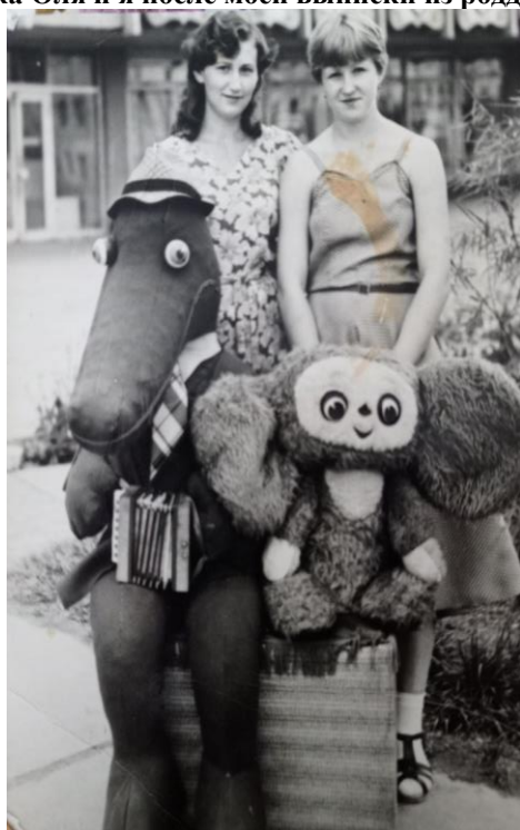
Студенческая фотография, бабушка справа