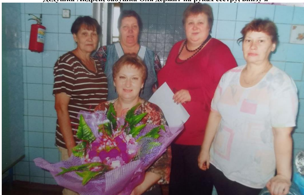
День рождения одной из сотрудниц на работе, бабушка в красном