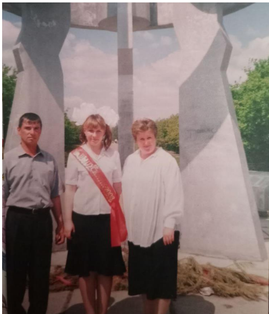
Выпускной моей мамы