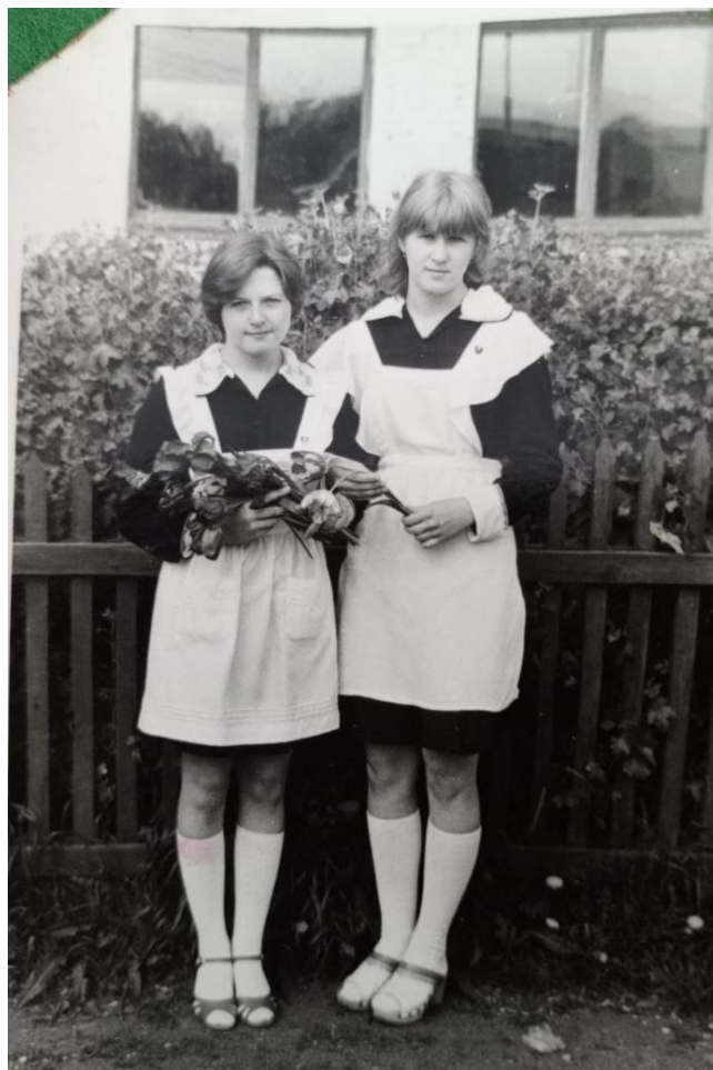
Школьная фотография: Бабушка справа