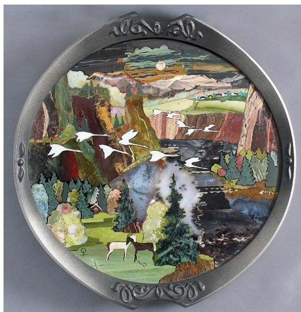
(картины Юрия Шевцова)