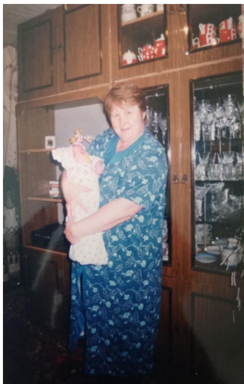
Бабушка Оля и я после моей выписки из роддома