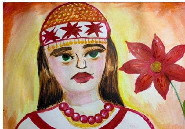
Чувашская сказка «Сказ про то, как Чебок город построил», рисунок Патеевой Анастасии