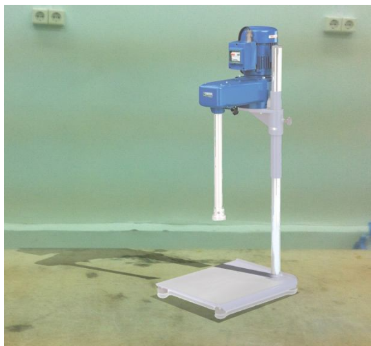
Рисунок 2 – роторный диспергатор ИКА Т 65 D ULTRA-TURRAX

Диспергирование системы методом механического измельчения выполнялось с помощью роторного диспергатора погружного типа ИКА Т 65 D ULTRA-TURRAX производства ООО «ФАРМКОНТРАКТ» г. Истра (рисунок 2).