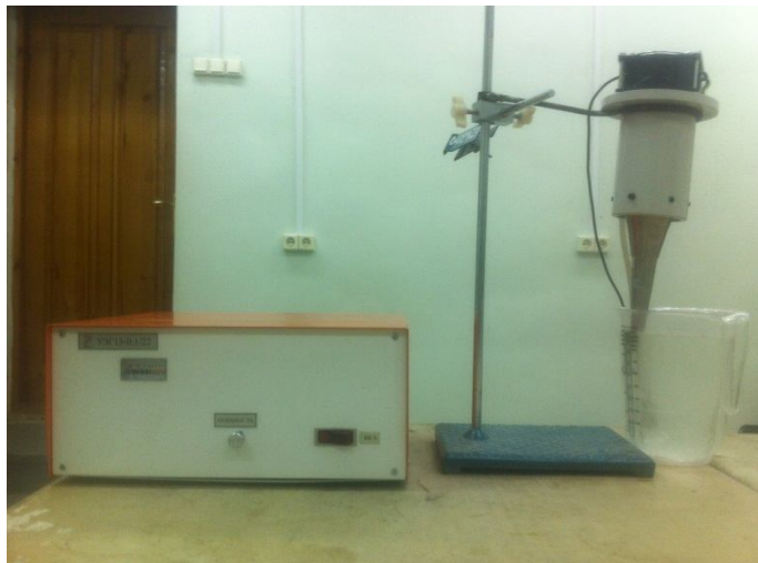
Рисунок 1 – лабораторный ультразвуковой диспергатор УЗД 2-0.1/22

г. Санкт-Петербург с выходной мощностью 100 Вт и рабочей частотой 22 кГц (рисунок 1).