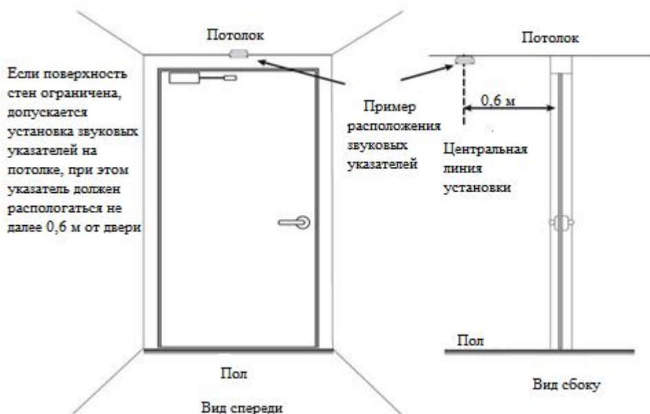
Рисунок 3 - Установка звуковых указателей на потолке

Планы эвакуации, указатели и надписи, требуемые нормативными документами, являются визуальными средствами обнаружения и нахождения пути эвакуации. Обычно надпись «ВЫХОД» является основным средством указания выхода, зоны безопасности или других видов эвакуации. Если был подготовлен план эвакуации, то он может включать схемы, указывающие места расположения и маршруты выхода. Однако, люди могут не иметь возможности изучить и понять такие схемы, или не смогут в реальности увидеть маршрут выхода, указанный на схеме.