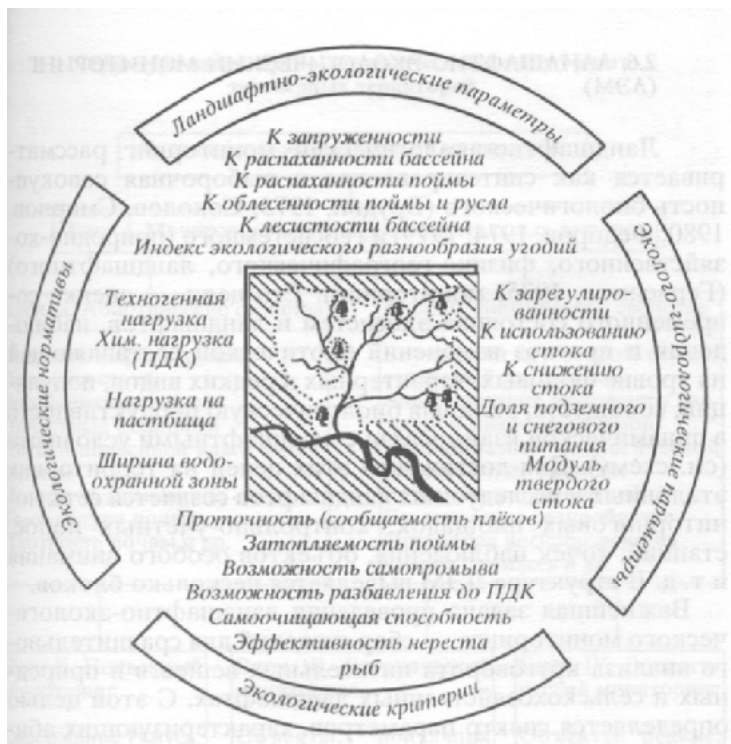
Показатели оптимизации природопользования в бассейне малой реки