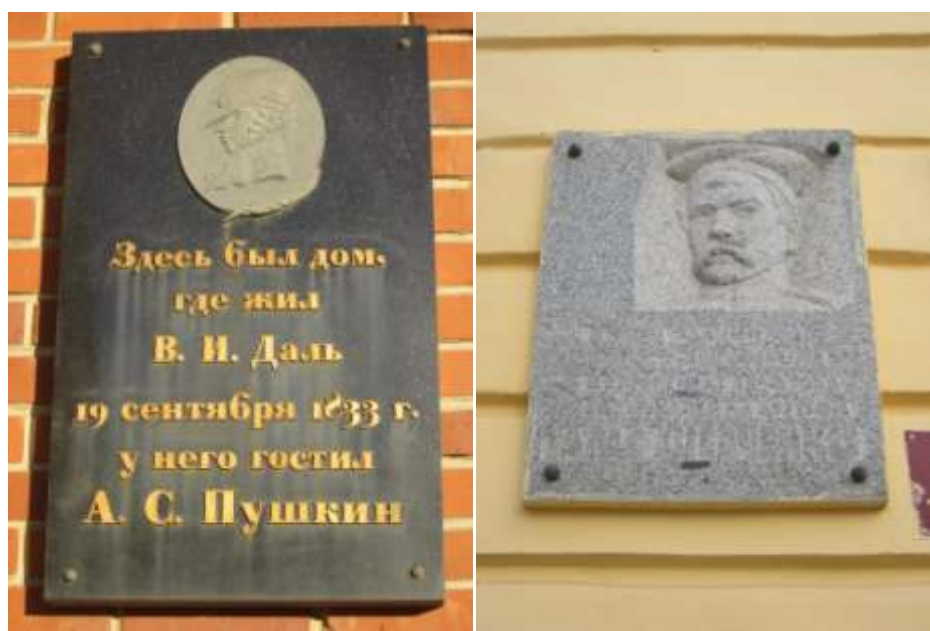
Рис. 6 - Мемориальные доски, посвященные деятелям культуры, Ленинская, 44, Советская, 24

В Оренбургской области сегодня действует 23 нефтегазовых месторождения [4]. Компания, занимающаяся добычей, переработкой и транспортировкой углеводородного сырья – ООО «Газпром добыча Оренбург» – дочернее общество ПАО «Газпром» и ООО «Газпром переработка» [5].