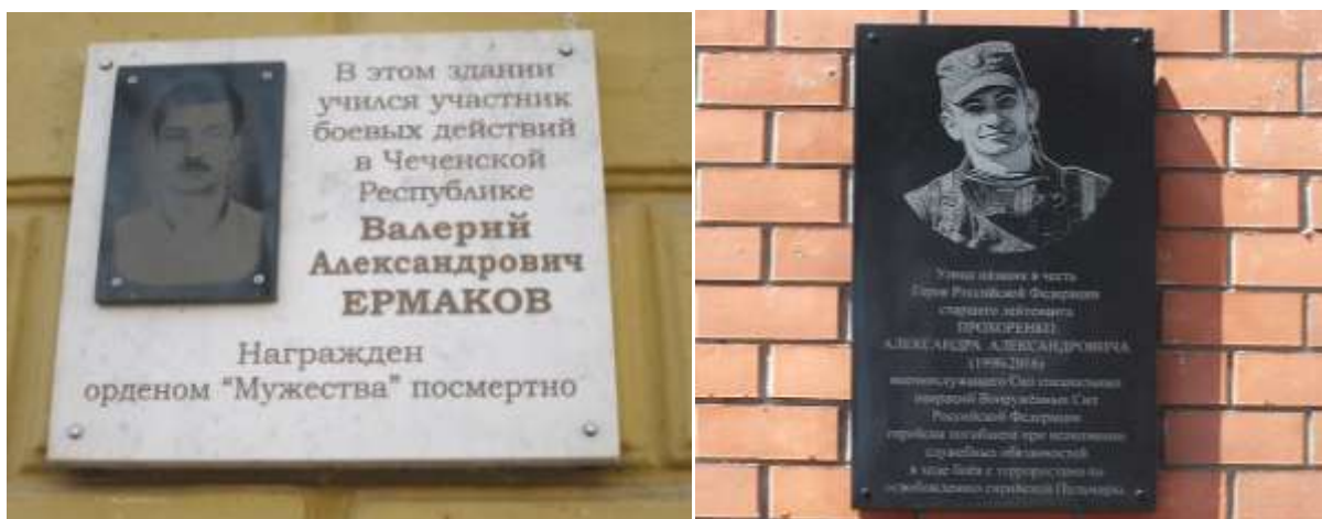
Рис. 4 - Мемориальные доски, посвященные участникам военных действий, ул. Советская, 19, пр. Нижний, 8/1 [1].

Прошло более 20 лет со дня ввода российских войск на территорию Чеченской республики. Первая и вторая военные кампании на Северном Кавказе унесли жизни 234 оренбуржцев. В память о них установлены мемориальные доски [2].