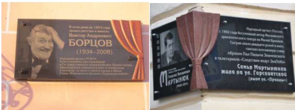
Рис. 7 - Мемориальные доски, посвященные деятелям культуры, Кирова 8, Советская 24/Правды 8

и «Капитанской дочери». Т.Г. Шевченко отбывал ссылку в Оренбургском крае [6].