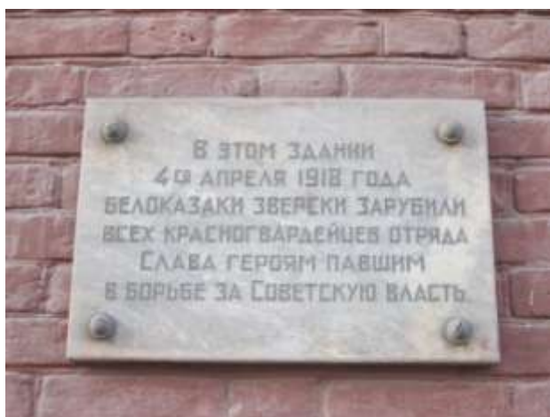
Рис. 2 - Мемориальная доска, посвященная военным революционным событиям, ул. Ленинская, 56

Оренбург – один из множества городов, заставших кровопролитные события Великой Октябрьской социалистической революции. Память о них сохраняется на мемориальных досках основных улиц города.