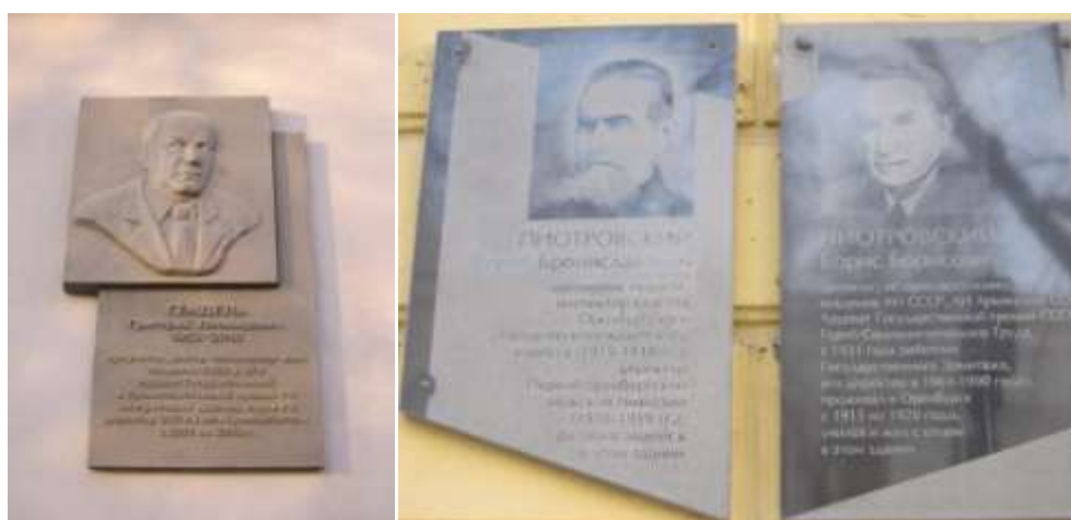
Рис. 8 - Мемориальные доски, посвященные деятелям науки, Пушкинская 20, Советская, 19

Мемориальная доска, посвященная Г.Я. Мартынюку, является ярким примером оригинального архитектурного расположения доски: она имеет угол 90 градусов и своими плоскостями выходит сразу на две улицы: Советскую и Правды.