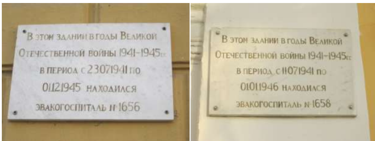
Рис. 3 - Мемориальные доски, посвященные военным событиям, ул. Советская, 19 и 24

Оренбург – один из множества городов, заставших кровопролитные события Великой Октябрьской социалистической революции. Память о них сохраняется на мемориальных досках основных улиц города.