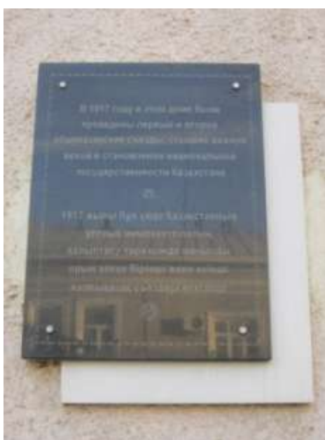
Рис. 9 - Многоязычная мемориальная доска, Пушкинская, 18

В зависимости от языка предоставляемой информации мемориальные доски можно классифицировать на одноязычные и многоязычные. Соответственно одноязычная мемориальная доска содержит информацию на русском языке. На многоязычных досках информация дублируется на иностранных языках (рис. 9).