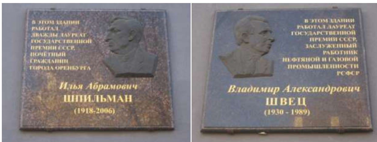
Рис. 5 - Мемориальные доски, посвященные деятелям труда, Пушкинская, 20\Советская, 21

Доски расположены здесь не случайно: в здании располагается ООО «ВолгоУралНИПИГаз» - научно-исследовательский и проектный институт нефти и газа, дочернее общество ООО «Газпром добыча Оренбург» [3].