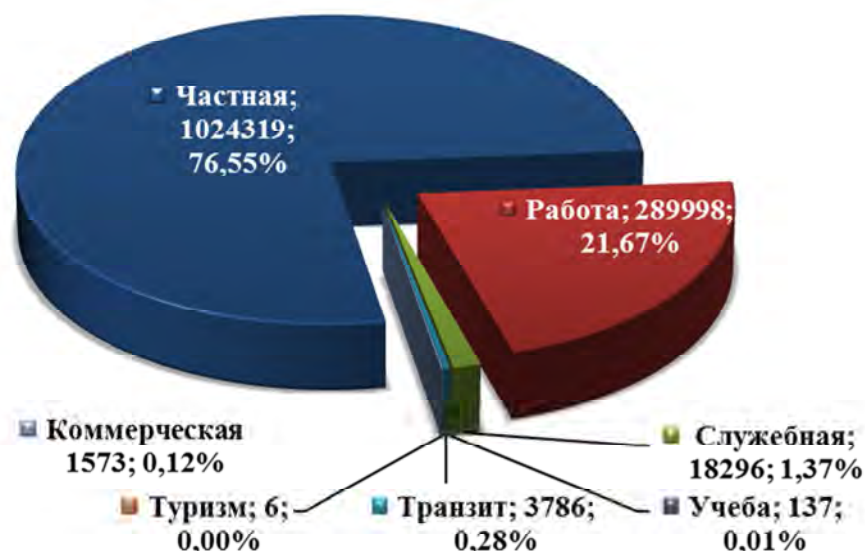
Рисунок 2. Цели въезда иностранных граждан и лиц без гражданства, заявленные в пунктах пропуска на Оренбургском участке российско-казахстанской государственной границы [2].

Более 20 тысяч иностранных граждан (почти 1/4 часть въезжающих) едут в регион в поисках работы, из них 5800 по разрешениям на работу, остальные – по патентам у физических лиц. Основным поставщиком рабочей силы на рынок труда региона являются Республики Узбекистан и Таджикистан.