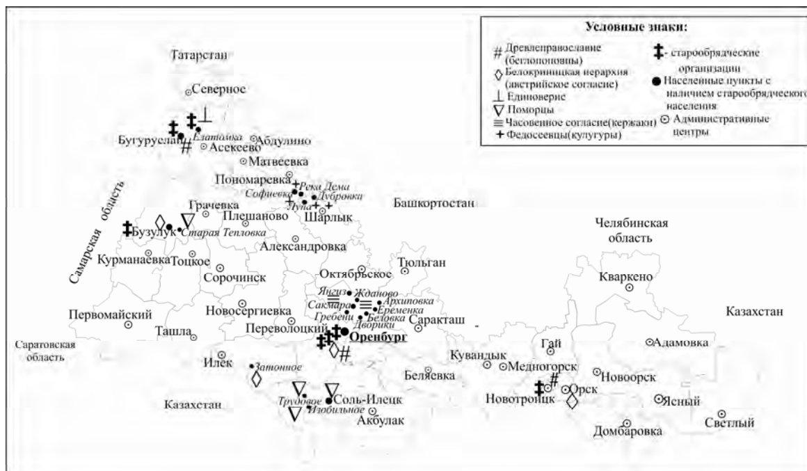
Рис.2 Старообрядческие общины в Оренбургской области (современное расселение).