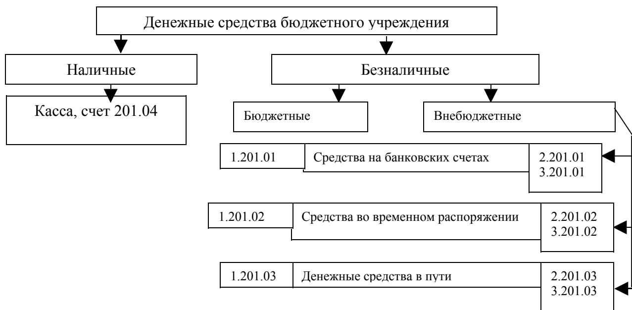
Рисунок 8 - Структура денежных средств бюджетного учреждения, как получателя бюджетных средств

Лимит бюджетных обязательств – объем бюджетных обязательств, определяемый и утверждаемый для распорядителей и получателей бюджетных средств органом, исполняющим бюджет (ст.223 БК РФ).