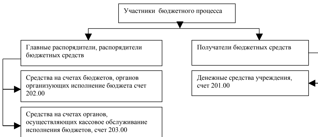
Рисунок 7 - Схема учета бюджетных средств у участников бюджетного процесса

Участники бюджетного процесса и порядок учета денежных средств у них представлен на рисунке 7.