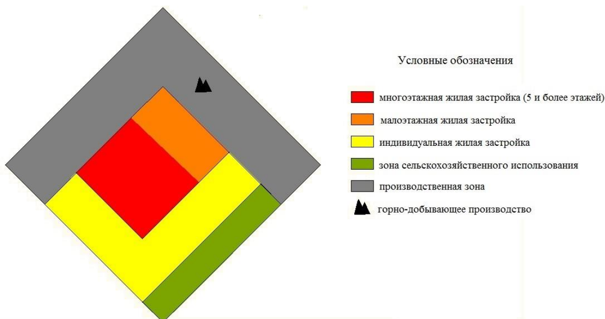
Рисунок 3 – Геокартоид города Гая

Новотроицк включён в категорию «Монопрофильные муниципальные образования Российской Федерации (моногорода) с наиболее сложным социально-экономическим положением». Является промышленным городом, на его землях действуют крупные и средние предприятия, на которых занято более 30 тысяч человек. Экономику города в значительной мере определяет промышленность, на её долю приходится 95,8 % от общего объёма выпускаемых товаров и услуг. Так большая часть города занята производственной зоной, она сосредоточена на востоке и северо-западе. Индивидуальная жилая застройка располагается в северной части города. В центральной части находится малоэтажная жилая застройка, а многоэтажная жилая застройка сосредоточена в южной части г. Новотроицка [5].