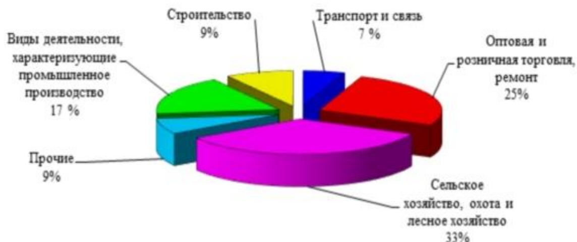
Рисунок 2 - Распределение средних предприятий по видам экономической деятельности в 2016 году

Несколько по-другому распределяются малые и средние предприятия в зависимости от выручки (оборота). Распределение по видам экономической деятельности оборотов малых (с учётом микропредприятий) и средних предприятий представлено на рисунках 3 и 4.