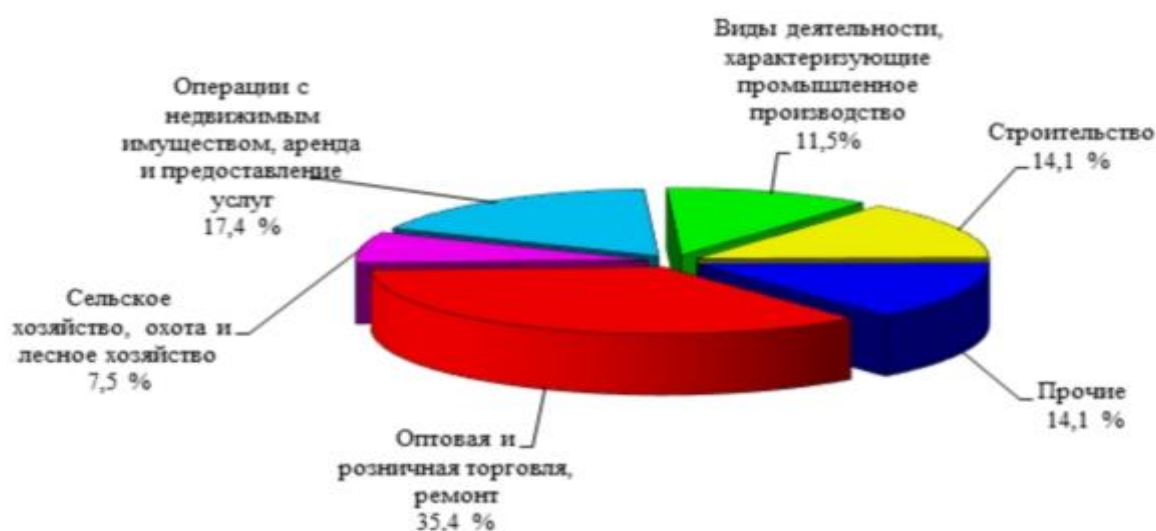
Рисунок 1 - Распределение малых предприятий (с учетом микропредприятий) по видам экономической деятельности в 2016 году

Распределение малых (с учетом микропредприятий) и средних предприятий по видам экономической деятельности представлено на рисунках 1 и 2.