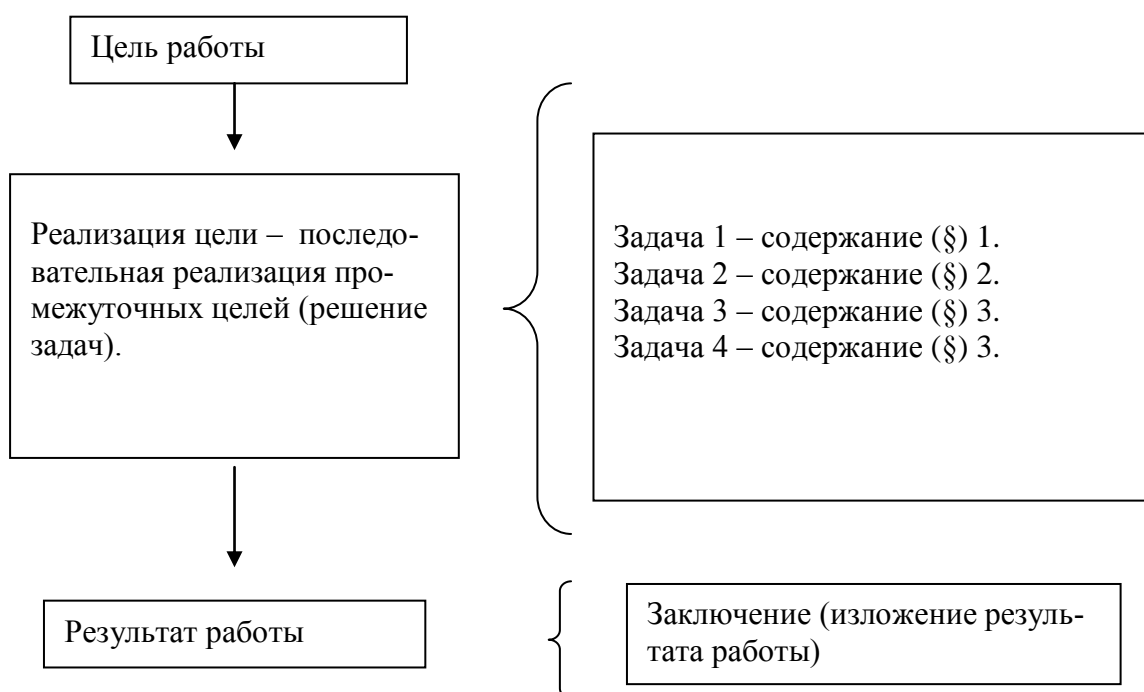
Рис. 1 Соотношение цели, задач, содержания и результата работы

Соотношение цели, задач, содержания и результата работы представлено (примерной) схемой (рис. 1).