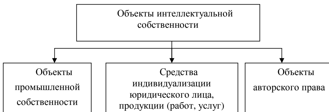
Рисунок 1 – Группировка объектов интеллектуальной собственности

Пример - В соответствии с рисунком 1 объекты интеллектуальной собственности представлены тремя группами.