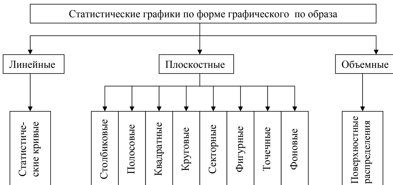
Рисунок 4 - Классификация статистических графиков по форме графического образа

Статистические карты – графики количественного распределения по конкретной территории.