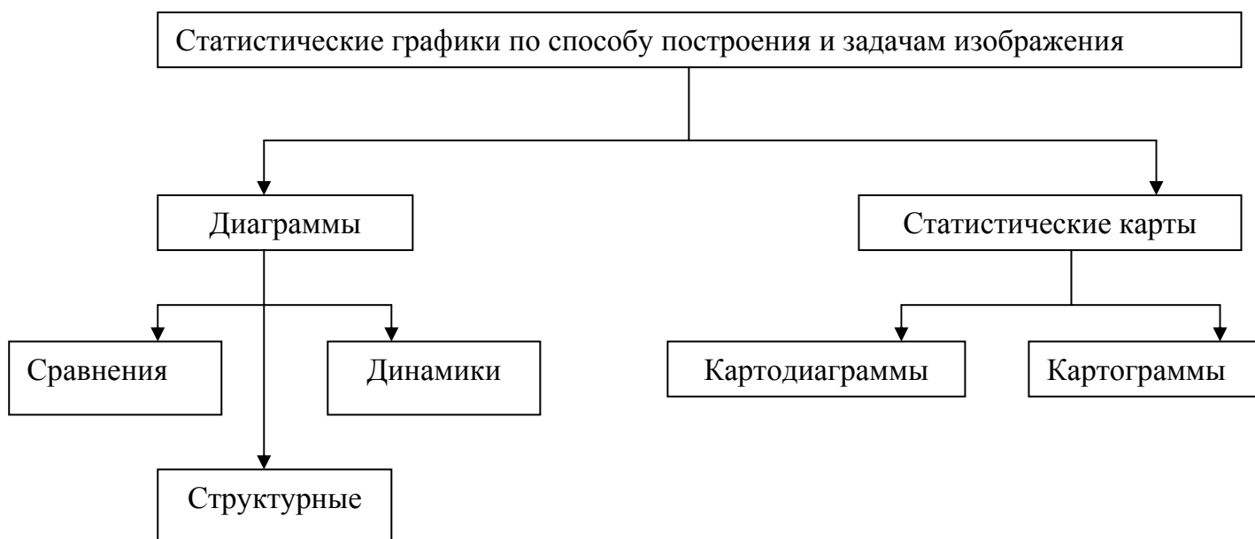
Рисунок 5 - Классификация статистических графиков по способу построения