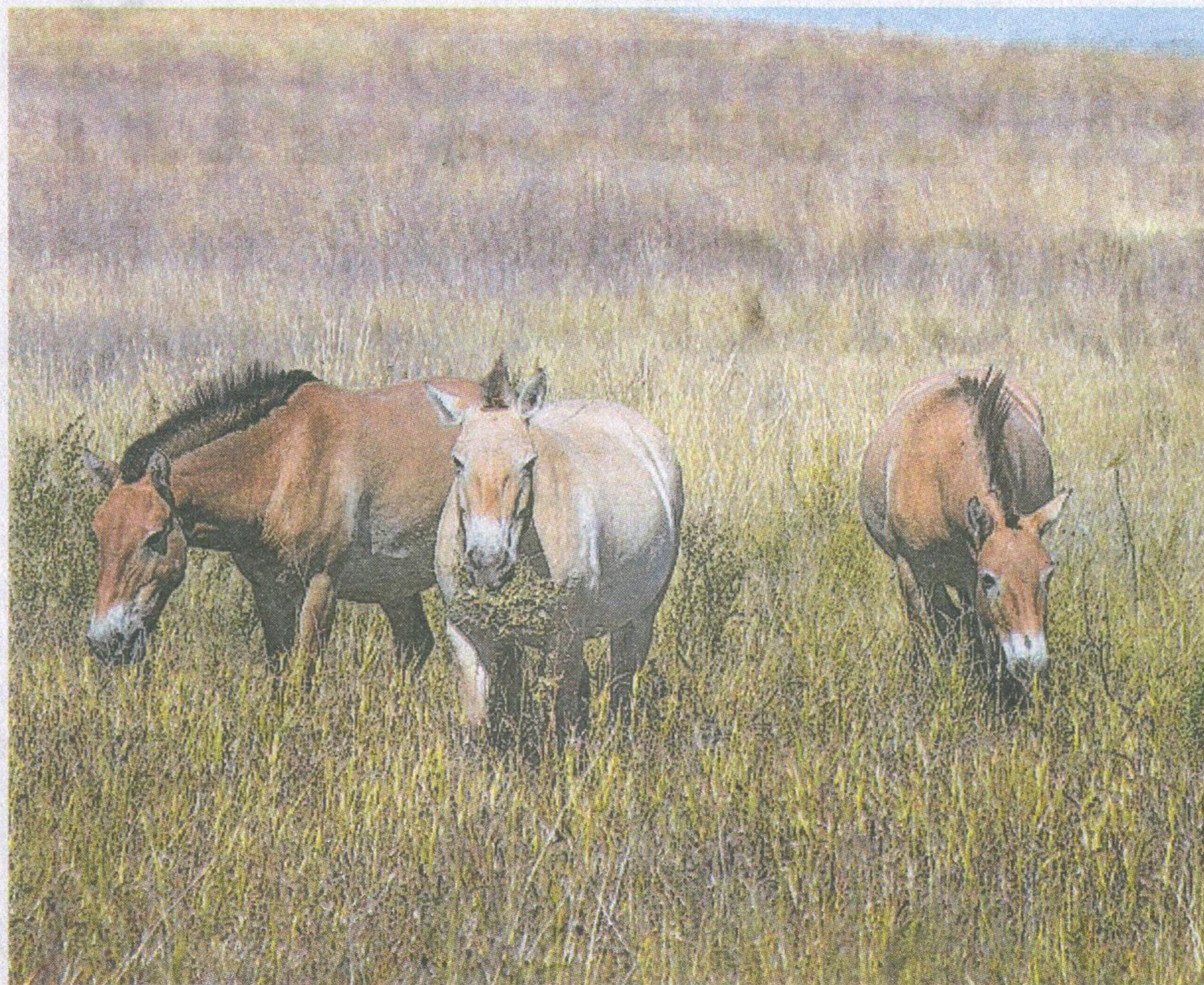
Лошади Пржевальского не прочь выбрать кое-что из пищухиных запасов