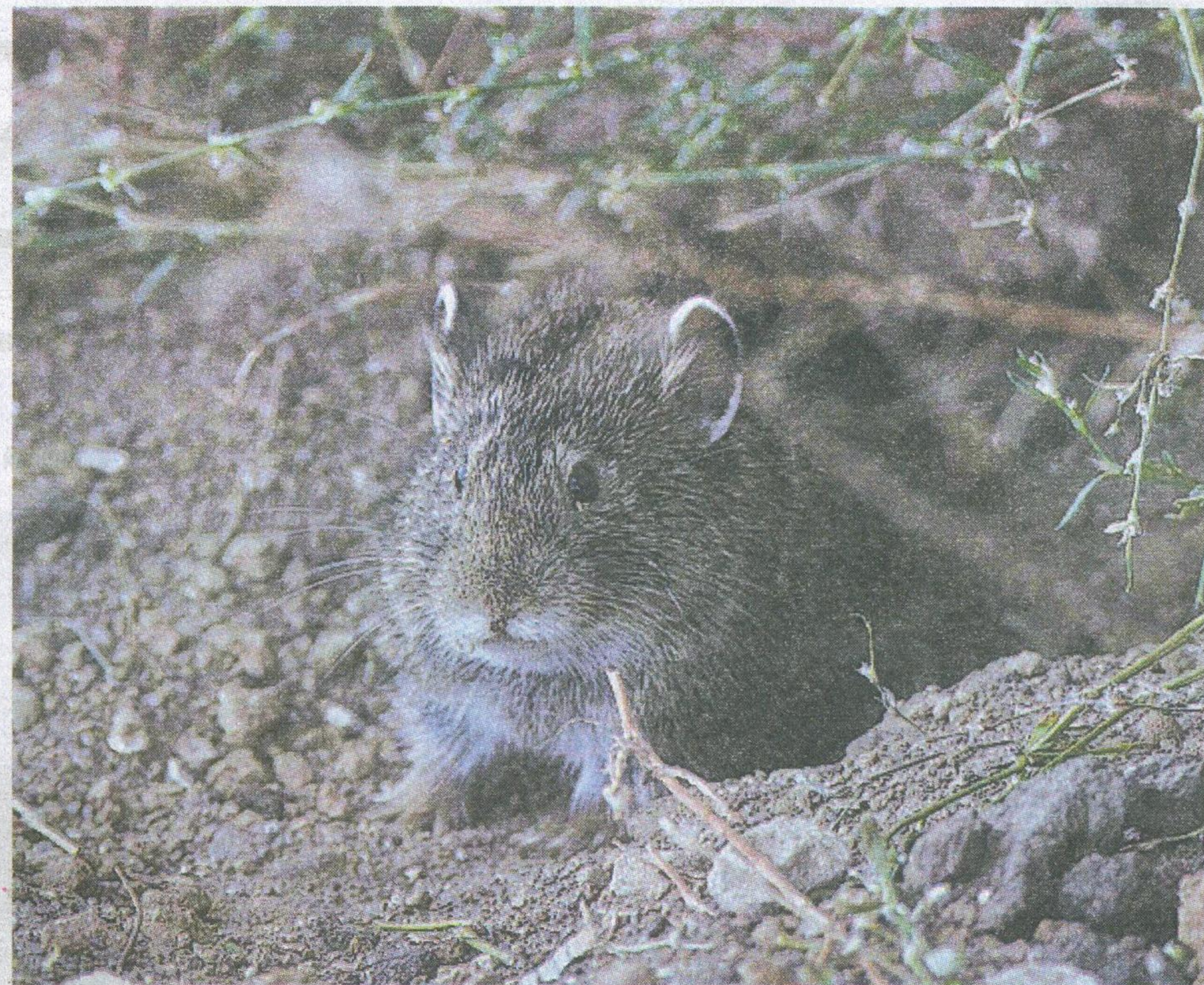
Пищуха по кличке Фрося