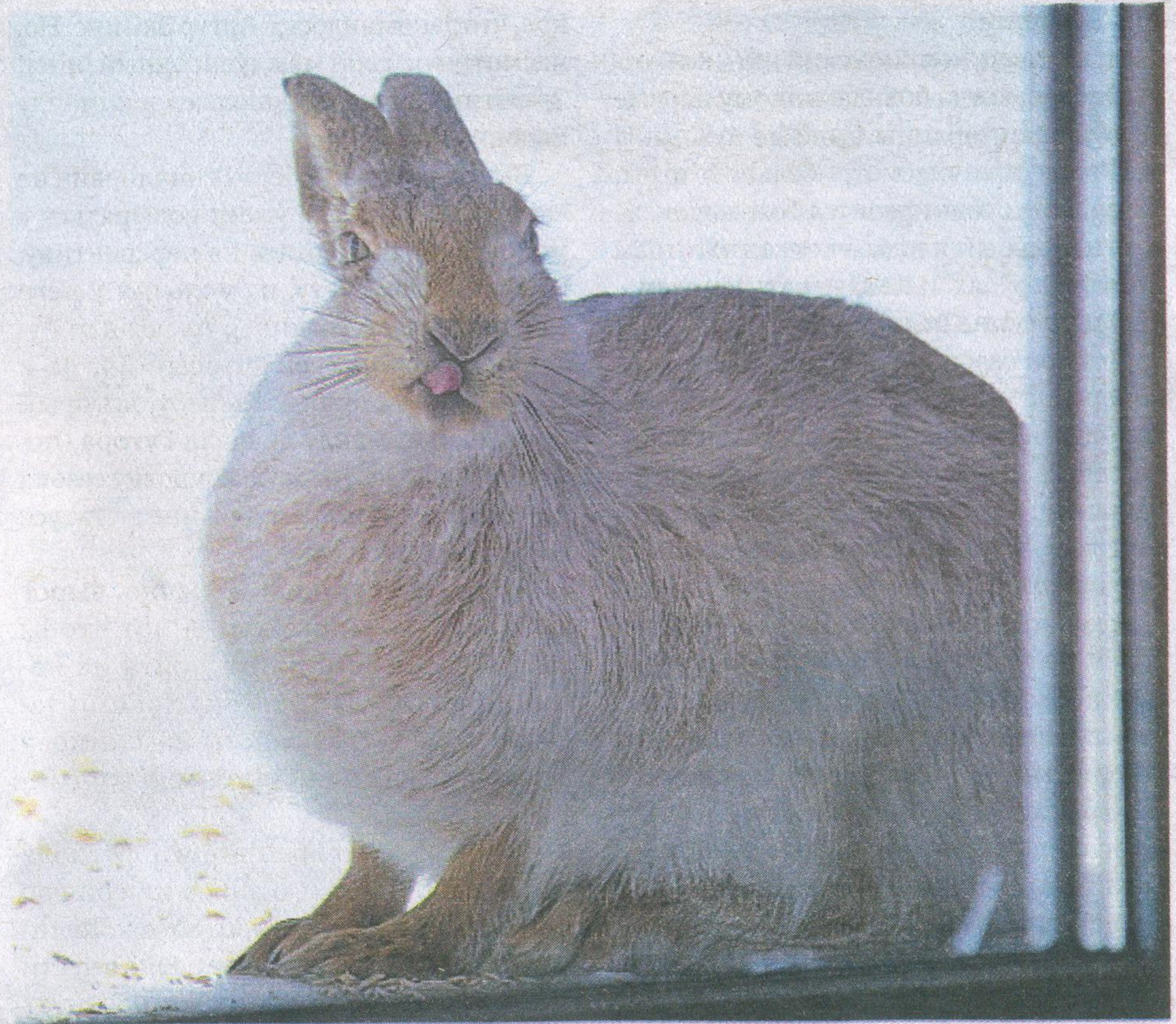
Заповедный заяц в окне