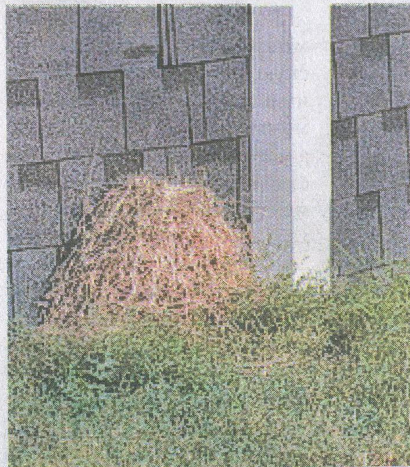
Стожок от пищухи у здания кордона

У этих животных есть замечательная особенность – они питаются, в основном, травой и побегами кустарников, и на зиму заготавливают себе сено, пряча его в норах или складывая стожки неподалёку. Высота стожков может достигать полуметра. Пищуха обязательно ворошит