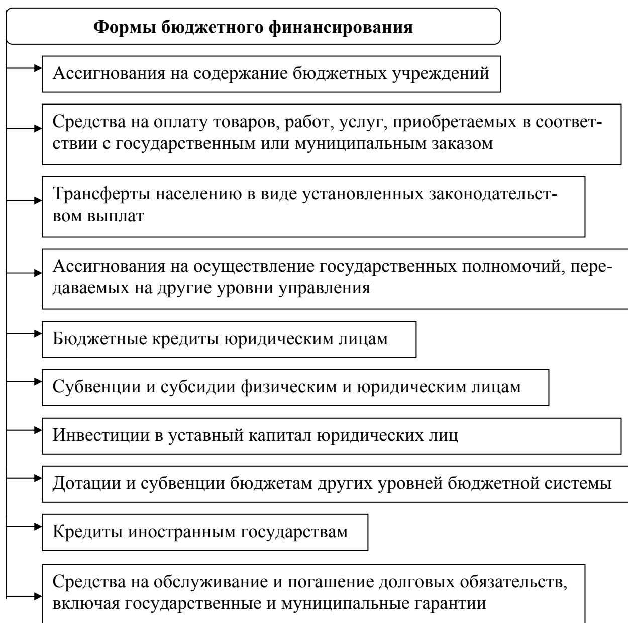
Рисунок 3 – Формы бюджетного финансирования

Характеристику форм бюджетного финансирования предлагается про- извести, в соответствии с рисунком 3