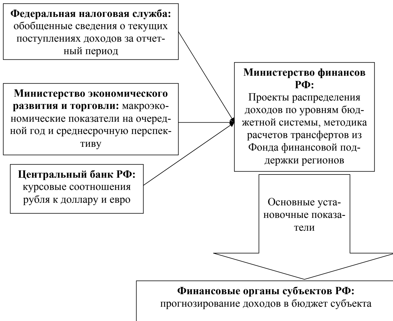
Рисунок 2 – Этапы расчета контингентов доходов

Организацию работы по планированию доходов бюджетов студенту предлагается изучить в соответствии с рисунком 2.