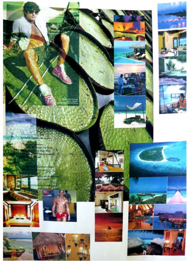
Рисунок А.2 – Коллаж. Тема «Природа»