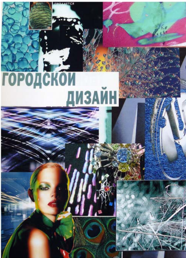
Рисунок А.1 – Коллаж. Тема «Городской дизайн»