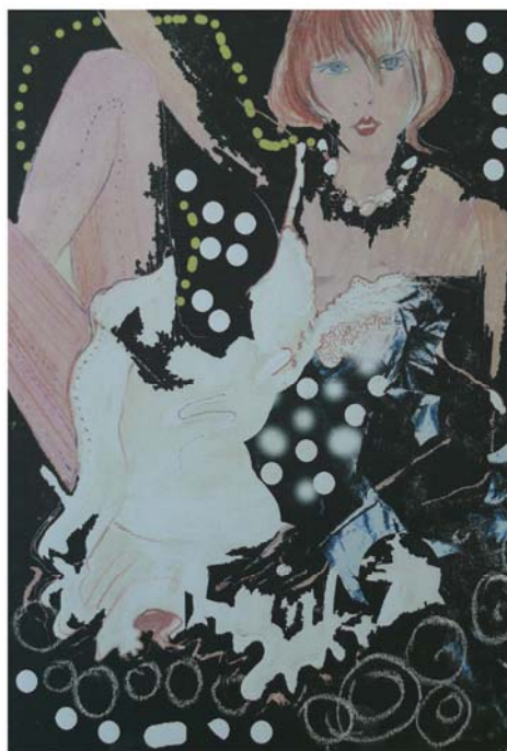
Рисунок Б.3 – Тема: «Геометрия» Идея: коллекция женской нарядной одежды «Горох»