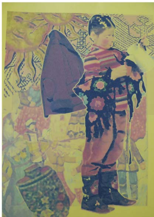
Рисунок Б.5 – Тема: «Этно». Идея: коллекция детской одежды «Вишневое варенье»