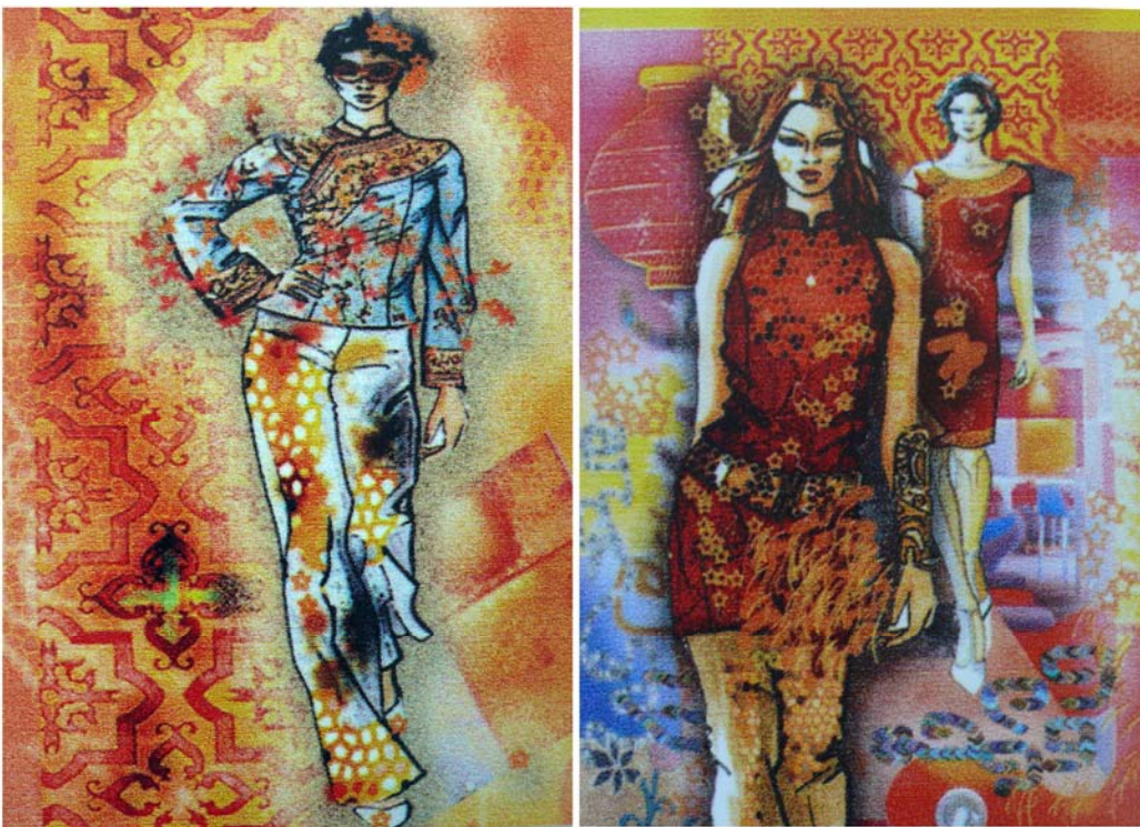
Рисунок Б.8 – Тема: «Этно» Идея: коллекция нарядной женской одежды «Красный Восток»