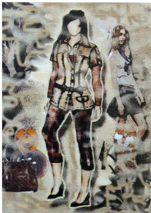
Рисунок Б.2 – Тема: «Город» Идея: коллекция женской одежды «Средневековье»