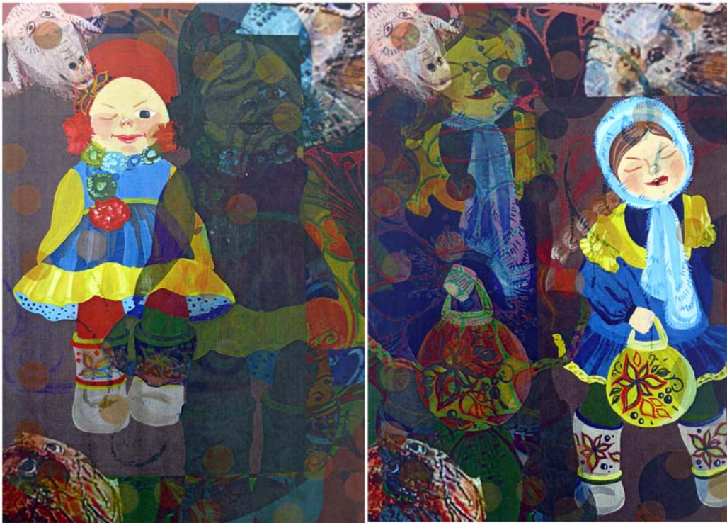
Рисунок Б.7 – Тема: «Этно» Идея: коллекция детской одежды «Масленица»