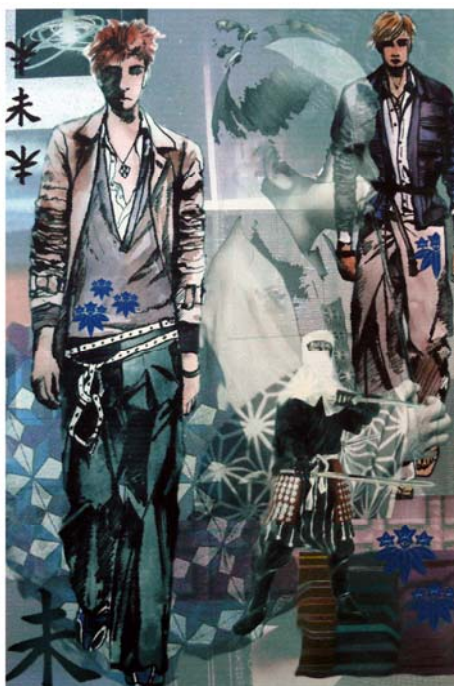
Рисунок Б.4 – Тема: «Япония» Идея: коллекция мужской одежды «Самурай»