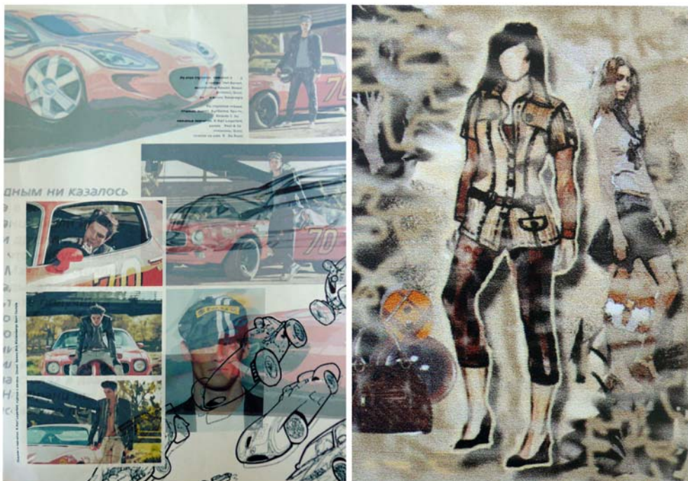
Рисунок Б.1 – Тема: «Спорт» Идея: коллекция мужской одежды «Автогонки»