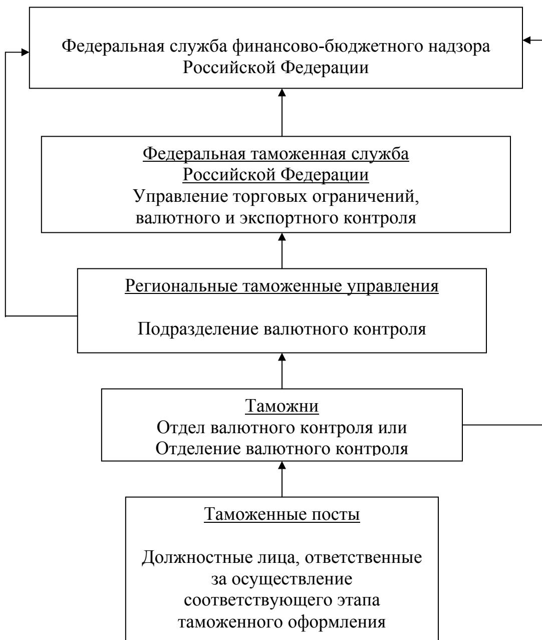
Рисунок Ж.1 – Организационная структура осуществления валютного контроля таможенными органами Российской Федерации (схема передачи информации)